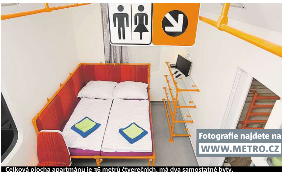
Celková plocha apartmánu je 36 metrů čtverečních, má dva samostatné byty.

la firma Altro podlahoviny. U něčeho jsem byl velmi zaskočen cenou, například žlutá kovová krabice na označovač jízdenek bez vnitřku, tedy pouze obal, stojí pět tisíc.