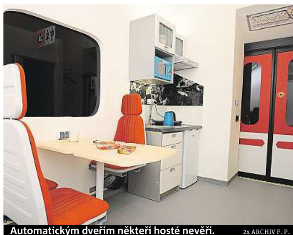
Automatickým dveřím někteří hosté nevěří.