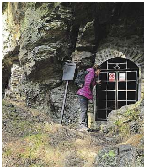
Můžete se vydat po stopách zlatokopů nebo na hrad Kašperk.