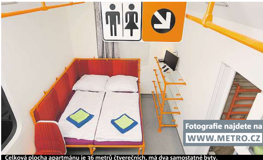
Celková plocha apartmánu je 36 metrů čtverečních, má dva samostatné byty.

la firma Altro podlahoviny. U něčeho jsem byl velmi zaskočen cenou, například žlutá kovová krabice na označovač jízdenek bez vnitřku, tedy pouze obal, stojí pět tisíc.