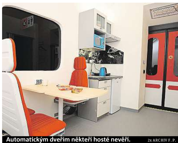
Automatickým dveřím někteří hosté nevěří.