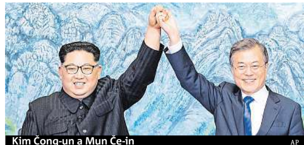
Kim Čong-un a Mun Če-in

Vůdce KLDŘ Kim Čong-un na pátečním mezikorejském summitu slíbil jihokorejskému prezidentu Mun Če-inovi, že Severní Korea v květnu uzavře jaderné testovací středisko a přizve k tomu americké experty. Centrum se po posledních zkouškách zřejmě stalo nepoužitelným, naznačili nedávno čínští vědci.