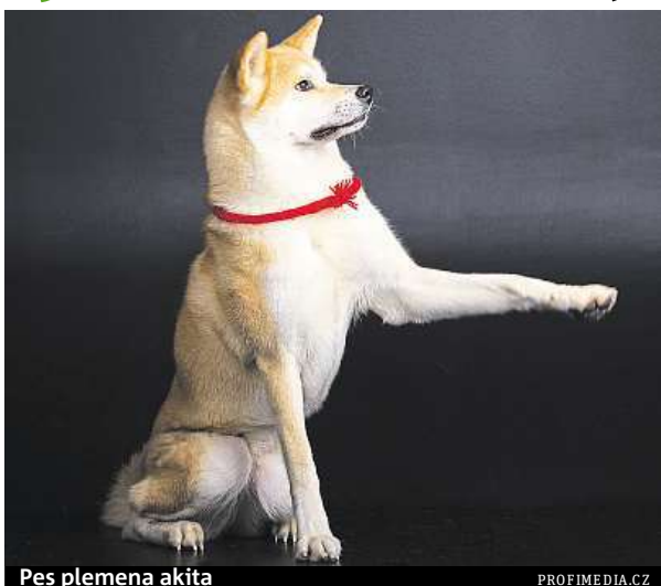
Pes plemena akita

Pověst zvířete ještě vzrostla počátkem roku, když olympijská vítězka Alina Zagitová prohlásila, jak tyto psy miluje, poté co je poznala, když v Japonsku trénovala. Místní představitel jí jednoho nabídl.