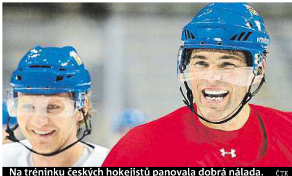
Na tréninku českých hokejistů panovala dobrá nálada. ČTK

Český tým čeká před zítřejším startem ještě jeden trénink a dopolední krátké rozbruslení v den zápasu. I nadále se bude zaměřovat na zakládání útoku a hlavně na aktivní hru v obranných pásmech. SIM a ČTK