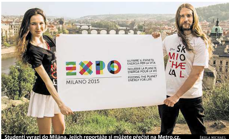
Studenti vyrazí do Milána. Jejich reportáže si můžete přečíst na Metro.cz.

Expa se letos účastní přes 140 zemí a projít všechny jejich pavilony se za tak krát-