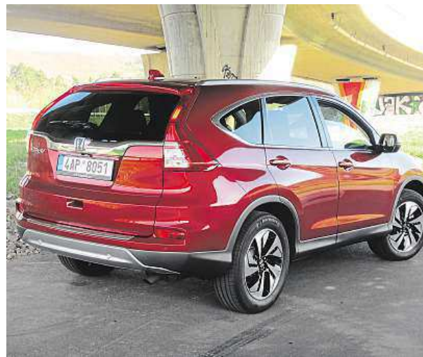
Zadní lampy jsou nádherné, stejně jako kola.