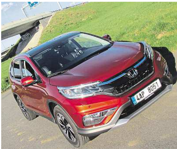
Z lesa na módní mola. Vzhled je drsnější, ale i měšťáčtější.