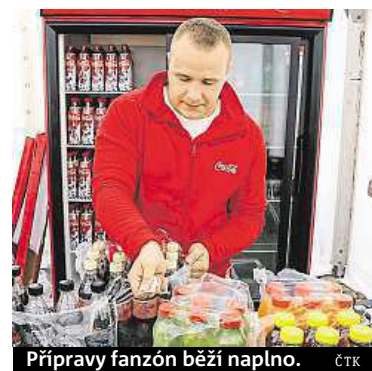
Přípravy fanzón běží naplno.

V hlavním městě bude prostor pro fanoušky třeba i na střeše Galerie Harfa nedaleko O2 areny nebo v dolní části Václavského náměstí. Příznivci v Ostravě můžou využít také fanzónu v Dolní oblasti Vítkovice. Svou zónu pro fanoušky bude mít dokonce také