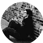
Vojtěch Bor Budu líbat svojí třešňou pod rozkvetlou slečnou.