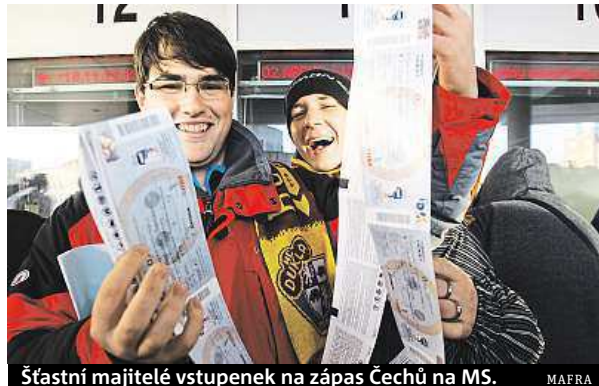
Šťastní majitelé vstupenek na zápas Čechů na MS.

V Ostravě se pracovalo hlavně na technologiích. Byl vyměněn audiovizuální systém, osvětlení a přibyla multimediální kostka nad ledem. Navíc hned v sousedství ČEZ Arény byla dokončena multifunkční hala, která bude při MS sloužit jako tréninková.