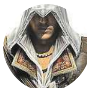
Pedro Auditore Da Firenze Vzhledem k tomu, že má pršet, tak ne, třešeň je jak cedník.