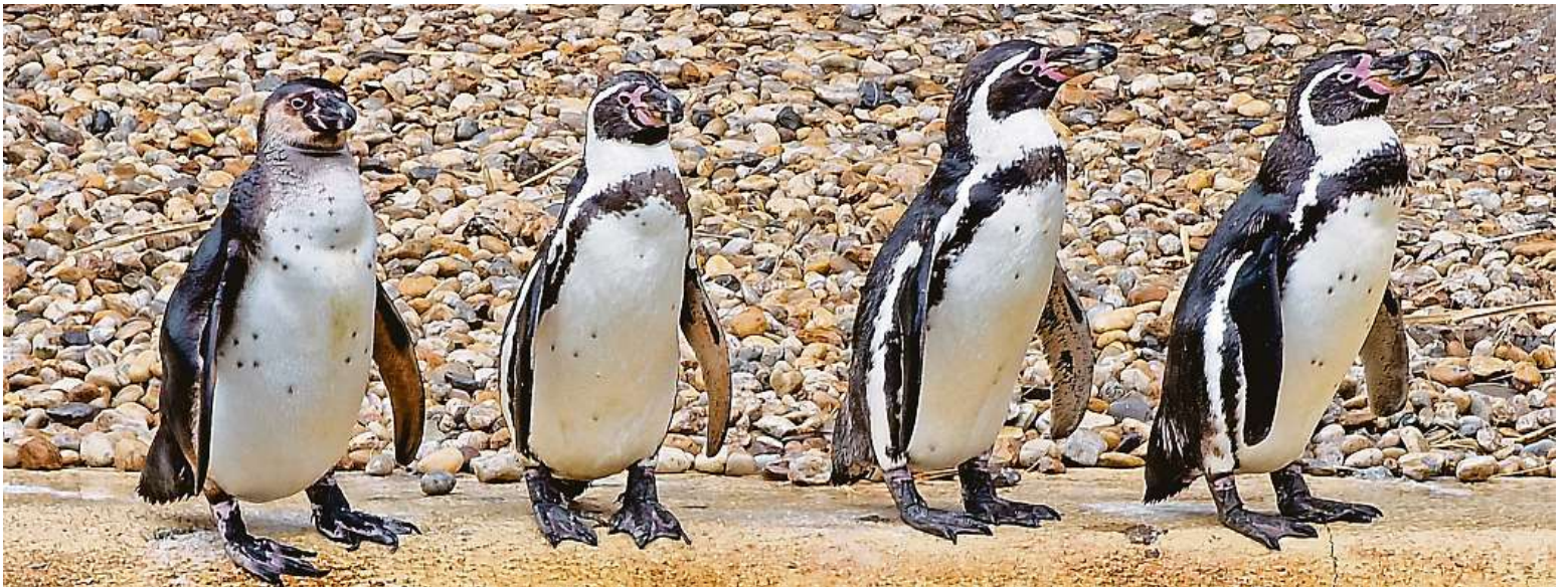
Tučňáci nastoupení v řadě se v plzeňské zoo těší na vaši návštěvu. Těšit se můžete také na nový výběh pro lvy nebo na rozmanitou botanickou zahradu. METRO

Čerstvé maminky. Po narození dítěte by za nimi automaticky měly jezdit asistentky hrazené státem. Porodní centra. Experti míní, že je nutné budovat speciální pracoviště. Apolinář. Otevřeli v novém STRANY 2, 4, 5