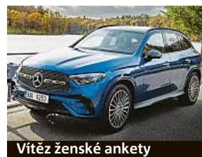
Vítěz ženské ankety

ná porota letos v únoru vybrala z 18 nominovaných vozů do zúženého kola sedm modelů: Alfa Romeo Tonale, BMW X1, Dacia Jogger, Mercedes-Benz GLC, Range Rover, ŠKODA Enyaq Coupé RS iV a Volkswagen ID. Buzz. Těchto sedm vybraných modelů