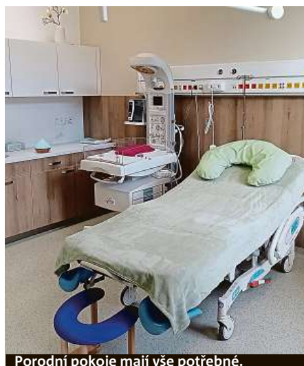
Porodní pokoje mají vše potřebné.