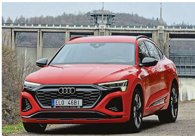
Za námi je hráz Slapské přehrady. Na autě si všimněte grafiky světlometů.

Až 408 koní a dojezd 600 kilometrů jen na elektřinu?