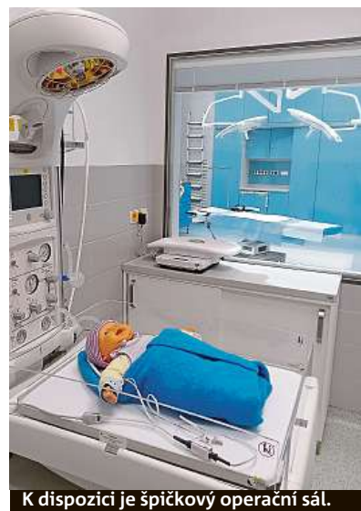
K dispozici je špičkový operační sál.