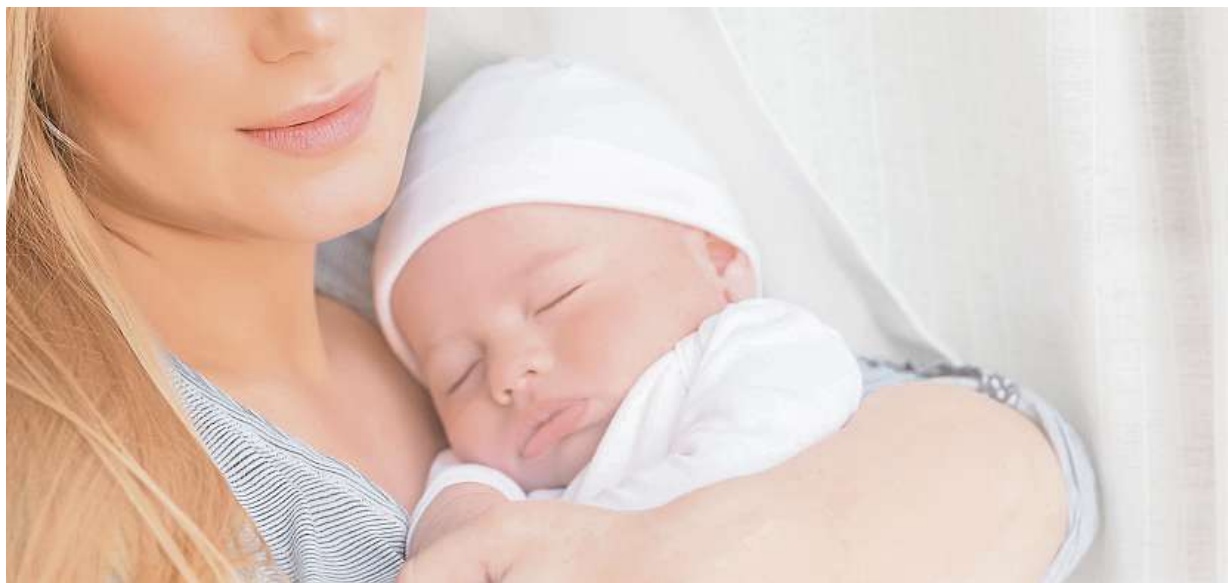
Rodičky by návštěvu asistentek doma ocenily.

„Byť by ženy teoreticky měly mít po porodu nárok na tři návštěvy porodní asistentky v domácnosti, tak praktic-