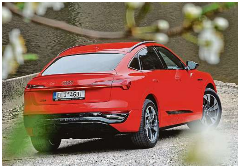
Karoserie sportback dává u Audi šanci jak stylu, tak praktičnosti.