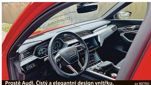
Prostě Audi. Čistý a elegantní design vnitřku.

My jsme však testovali Q8 s karoserií sportback v lepší a silnější verzi 55 e-tron quattro. I zde byla zvýšena kapacita akumulátoru při zachování stejné schránky. Nově dává 106 kWh využitelné kapacity, zvýšen byl i maximální dobojovací výkon. Podle nabíjecí křivky nabijete tento model výkonem až 170 kW z 10 na 80 procent při ideálních podmínkách už za půl hodiny a ujedete při plné kapacitě až 600 km podle metodiky měření WLTP.