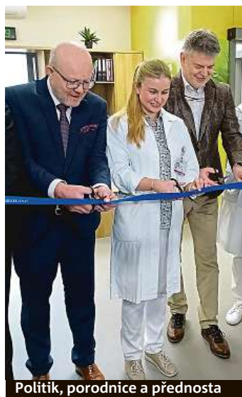
Politik, porodnice a přednosta

Po-Pá 8:00-20:00 hod. So - Ne 9:00-18:00 hod. Cena běžného místního hovoru. Zásilku obdržíte v diskretním balení.