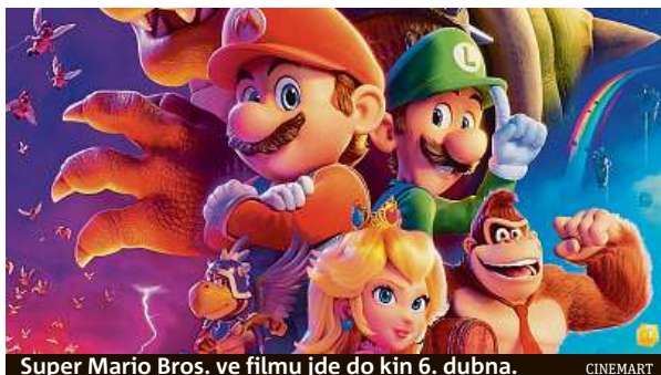
Super Mario Bros. ve filmu jde do kin 6. dubna.

Bráchrův Mario a Luigi na začátku svého nového filmového dobrodružství sní o tom, že povedou nejlepší instalatérskou firmu v New Yorku, což jim zatím moc nevychází. Možná právě proto jsou ochotni vrhat se i do úkolů, které jsou zjevně nad jejich nepatrné síly. Chuť jít do všeho po hlavě se jim ale záhy nevyplatí v momentě, kdy vlezou do podezřele vypadající obří zelené trubky a pár vteřin nato se jí nekontrolovatelně řítí do neznáma. Na druhém konci potrubí na ně čeká fantastický svět, jehož obyvatelé právě řeší dost podstatný problém. Ohavný ještěř Bowser, král jednoho ze zdejších království, se totiž rozhodl silou ovládnout všechny ostatní říše. V hledáčku má přede-