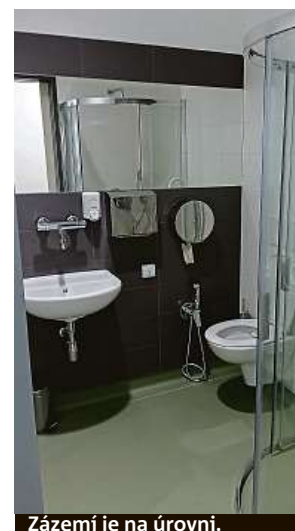
Zázemí je na úrovni.