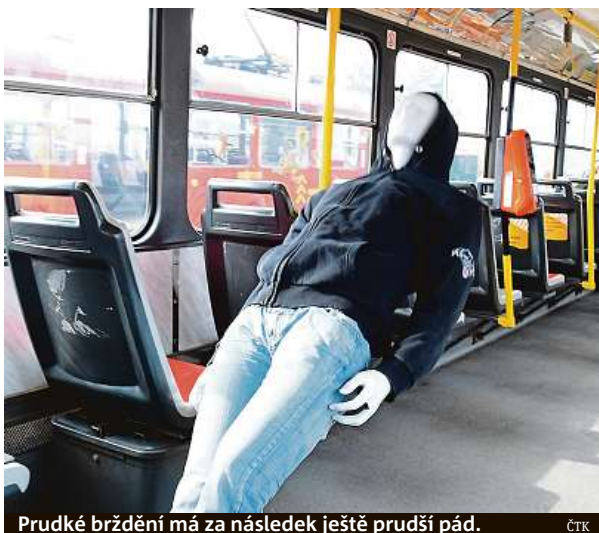
Prudké brzdění má za následek ještě prudší pád.

V některých situacích v běžném provozu je napří-