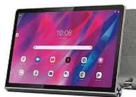
Tablet Lenovo 2x MIRONET

Spusťte některou ze současných náročných her či aplikací a objevte nekompromisní sílu ukrytou v osmijádřovém procesoru tepající na frekvenci 2,0 GHz. Samozřejmos-