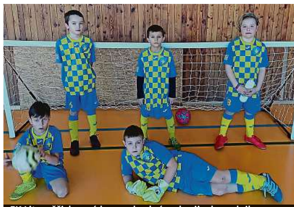
FK Litoměřicko má barvy shodné s ukrajinskou vlajkou. FB

V případě, že by oba kluci zůstali v Česku delší dobu, papírování by se určitě nevyhnu- li. „Ten starší říkal, že neví, jestli se v dohledné