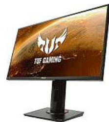
Pro libovolné použití

Výhody matného displeje ASUS oceníte zejména při práci ve světlých místnostech a ve chvílích, kdy se vám do monitoru opřou paprsky přímého světla. Skvělý herní monitor s nízkou odezvou ASUS VG259Q Gaming pořídíte v internetovém obchodu Mironet.cz za 5799 korun.