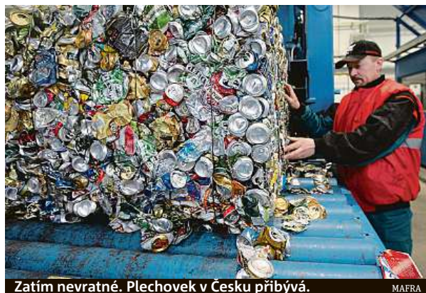
Zatím nevratné. Plechovek v Česku přibývá.

Podobně jako Prazdroj se i někteří další výrobci snaží vracet stále víc k produkci nápojů ve vratných obalech. Aby co nejméně zatěžovali životní prostředí už během výrobního procesu. Například Fritz-kola přichází s bioverzí svého nápoje, navíc ve vratné