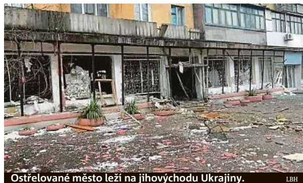
Ostřelované město leží na jihovýchodu Ukrajiny.