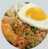
Raden Ted Sunny Je to prezident ze staré školy, a proto se mi líbí.