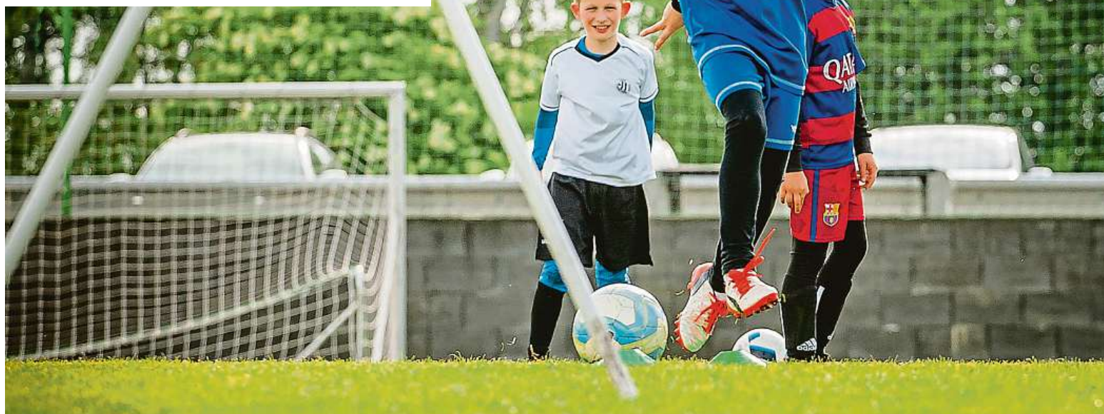
Děti uprchlíků se mohou v Praze zapojit se svými českými vrstevníky do sportovních tréninků v klubech. A to nejen fotbalových. Více prahasportovni.eu .