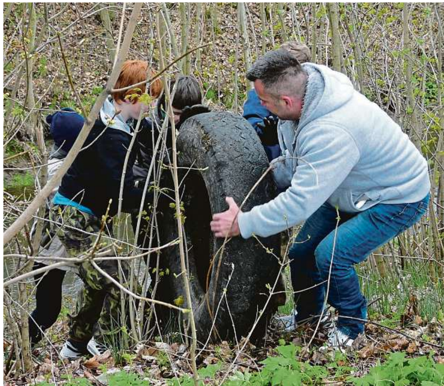
Do úklidu okolí se zapojují celé rodiny.