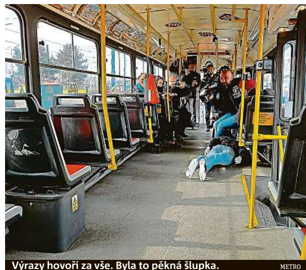
Výrazy hovoří za vše. Byla to pěkná šlupka. METRO

Během posledních let jsou celkové statistiky ohledně počtu úrazů v jedoucích autobusech spíše klesající, ale stále