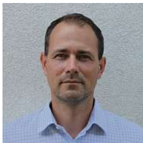
zi či předcházet případným rizikům.

Náročná na čas, psychiku a na pravidelné vzdělávání, ale zároveň velmi zajímavá, pestrá a nadprůměrně odměňovaná (pokud k ní přistupujete aktivně a s nadšením). Jde o práci, která v sobě nese značnou část poslání a osvěty, a dokonce lze říci, že je to do určité míry životní styl. Nejen to pouze o zajišťování potřeb klienta, ale dnes je to i o prevenci a společenské odpovědnosti. Je to práce pro Ty, kteří jsou komunikativní, rádi se učí novým věcem a jsou tak trochu i psychologové. Práce v pojišťovně především znamená neustále chránit své klienty před nástrahami každodenního života, pomáhat jim v nou-