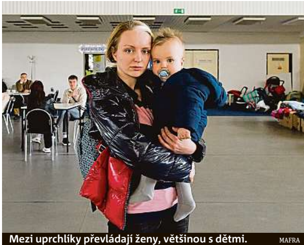
Mezi uprchlíky převládají ženy, většinou s dětmi.

Profesní růst a kariéerní rozvoj rodičů, inkluzivní přístup zaměstnavatelů k mateřské a rodičovské dovolené, rodiče a zaměstnavatelé v časech