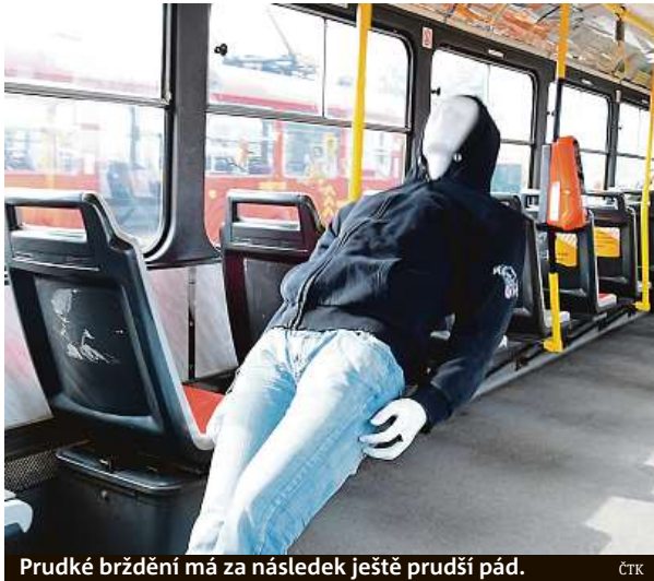
Prudké brzdění má za následek ještě prudší pád.

V některých situacích v běžném provozu je napří-