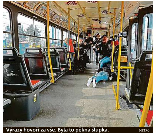
Výrazy hovoří za vše. Byla to pěkná šlupka. METRO

Během posledních let jsou celkové statistiky ohledně počtu úrazů v jedoucích autobusech spíše klesající, ale stále