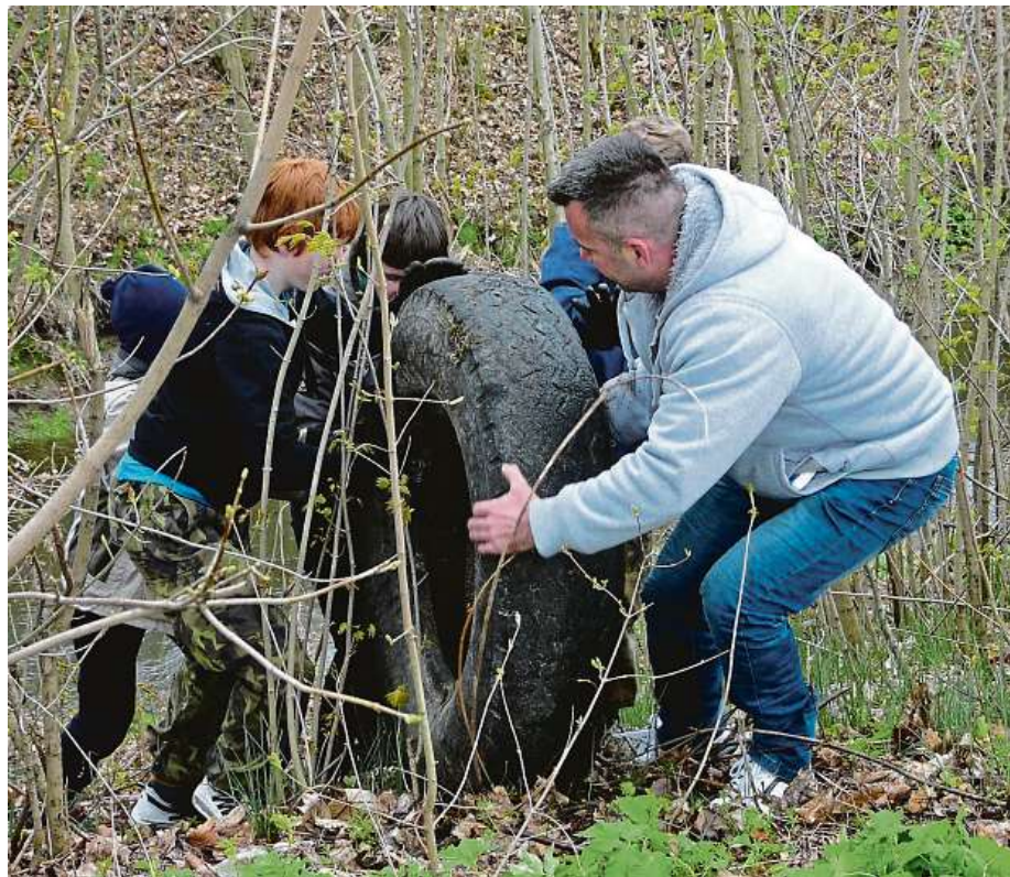
Do úklidu okolí se zapojují celé rodiny.