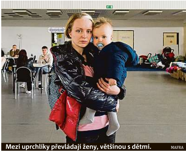
Mezi uprchlíky převládají ženy, většinou s dětmi.

Profesní růst a kariéerní rozvoj rodičů, inkluzivní přístup zaměstnavatelů k mateřské a rodičovské dovolené, rodiče a zaměstnavatelé v časech