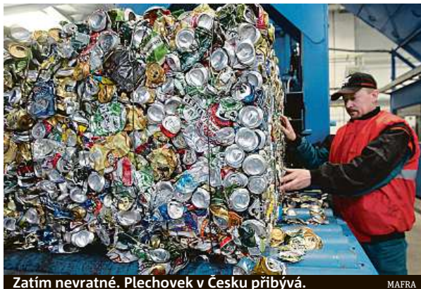
Zatím nevrtné. Plechovek v Česku přibývá. MAIRA

Statistiky odpadového hospodářství v Česku však nepřinášejí příliš lichotivá čísla. Ačkoli se někteří prodejci potravin nebo domácí chemie snaží zavádět bezobalový sys-