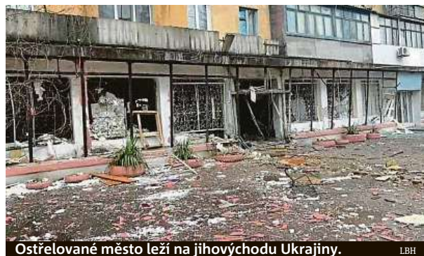
Ostřelované město leží na jihovýchodu Ukrajiny.