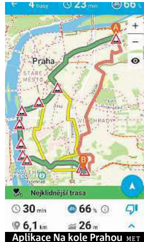
Aplikace Na kole Prahou MET

pro můj Windows Phone aplikace (snad zatím) není. Aplikace nás spolehlivě vede po tříkilometrovém okruhu centrem, funguje jako plnohodnotná navigace. Trasa mi připomíná legendární závod Paříž–Roubaix, kde závodníci