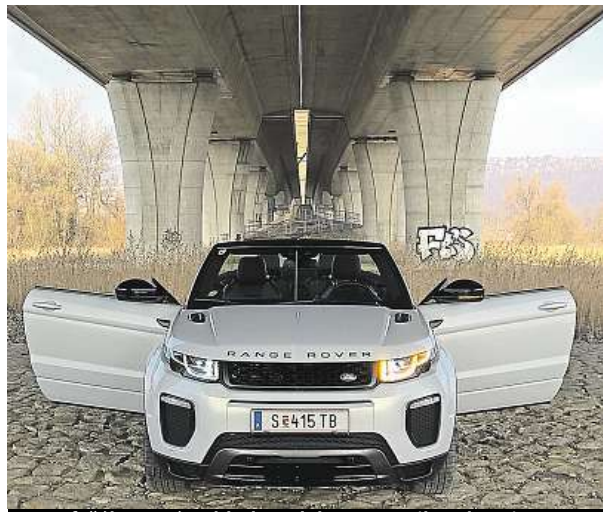
Je to fešák. Ostrý pohled modelu Evoque ihned zaujme.