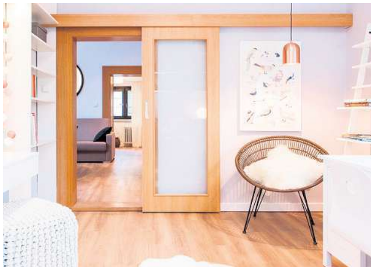
Posuvné dveře na zeď

V místech, kam se dveře odsouvají, počítejte s volným prostorem pro dveřní křídlo, bude stačit 8 cm ode zdi. Komodu nebo sedačku můžete tedy postavit i před zeď, kam se dveřní křídlo posouvá. Pozor si také dejte na umístění vypínačů a zásuvek – raději je umístíte mimo plochu, kam se dveře odsouvají.