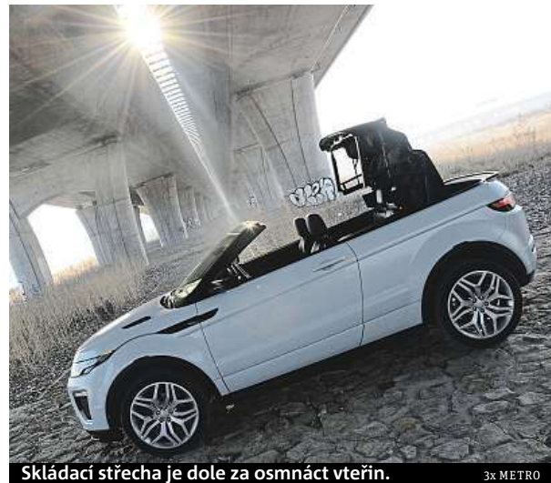
Skládací střecha je dole za osmáct vteřin.