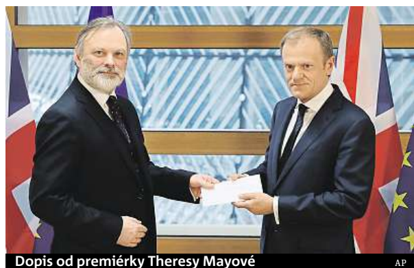
Dopis od premiérky Theresy Mayové

Mayová dodala, že má plán na nové zvláštní partnerství s Unií. S Bruslem chce mít „nový, speciální a hluboký vztah“. Dohody s EU chce premiérka dosáhnout do dvou let. Londýn podle ní rovněž hodlá co nejdříve zaručit práva občanů EU v Británii. Dopis aktivující článek 50 Lisabonské smlouvy o fungování EU krátce před vystoupením Mayové doručil Tuskovi britský velvyslanec při EU Tim Barrow. Mayová také uvedla, že respektuje, že není možné zůstat na evropském jednot-