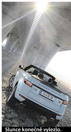
Slunce konečně vylezlo.