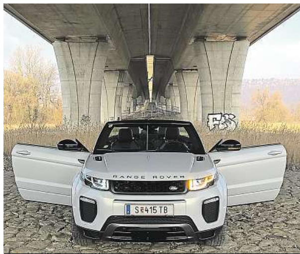
Je to fešák. Ostrý pohled modelu Evoque ihned zaujme.