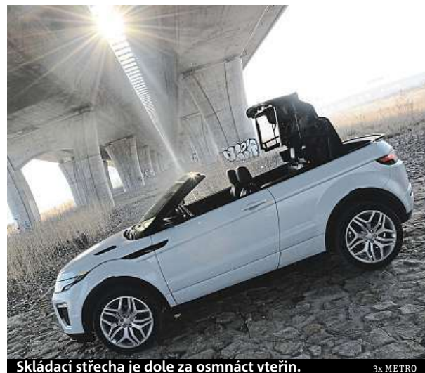
Skládací střecha je dole za osmáct vteřin.