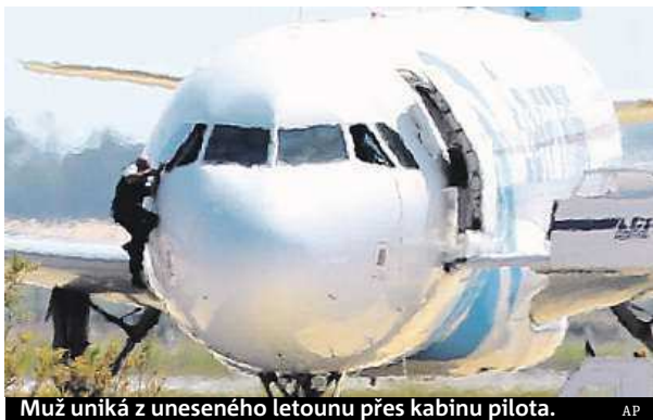
Muž uniká z uneseného letounu přes kabinu pilota.

Muž, který letoun společnosti EgyptAir unesl, se nakonec