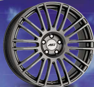
AEZ Strike graphite