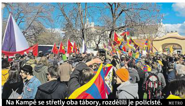
Na Kampě se střetly oba tábory, rozdělili je policisté.