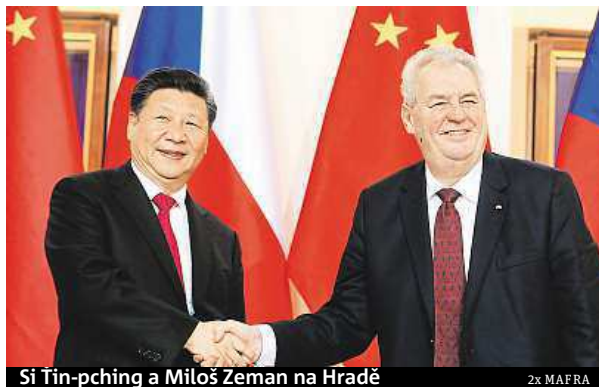
Si Ťin-pching a Miloš Zeman na Hradě