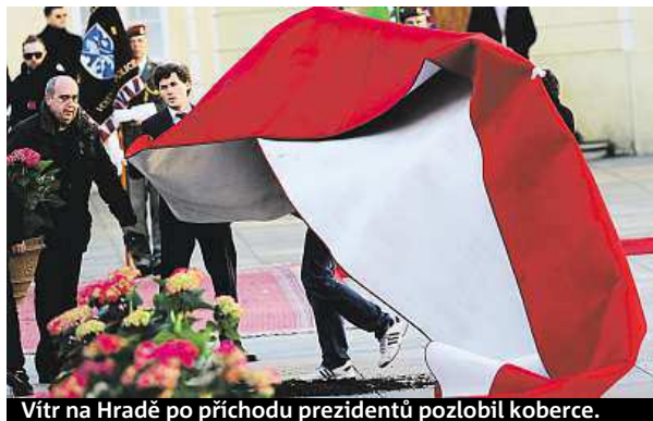
Vít na Hradě po příchodu prezidentů pozlobil koberce.