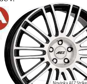
Novinka AEZ Strike