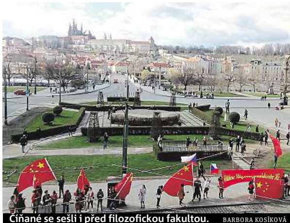
Číňané se sešli i před filozofickou fakultou.