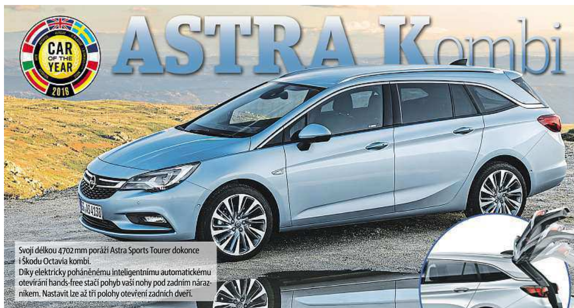
Svoji délkou 4702 mm poráží Astra Sports Tourer dokonce i Škodu Octavia kombi. Díky elektricky poháněnému inteligentnímu automatickému otevírání hands-free stačí pohyb vaší nohy pod zadním nárazníkem. Nastavit lze až tři polohy otevření zadních dveří.