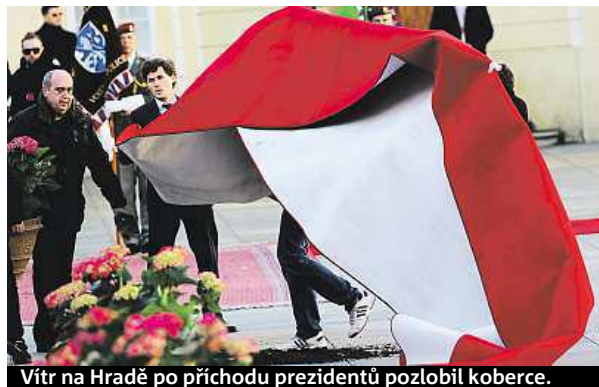
Vít na Hradě po příchodu prezidentů pozlobil koberce.