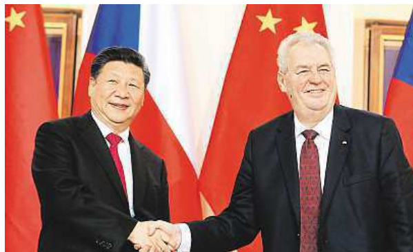
Si Ťin-pching a Miloš Zeman na Hradě

Pražané a turisté musí počítat i s dalšími omezeními. Dopoledne samozřejmě v okolí hotelu Hilton, kde je čínská návštěva ubytována, a pak hlavně na Žofíně a v jeho okolí, kde se oba prezidenti setkají s podnikateli z obou