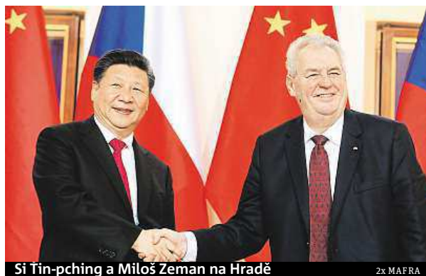
Si Ťin-pching a Miloš Zeman na Hradě