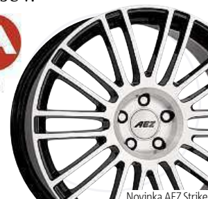
Novinka AEZ Strike