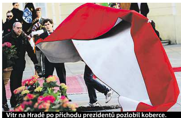
Vít na Hradě po příchodu prezidentů pozlobil koberce.