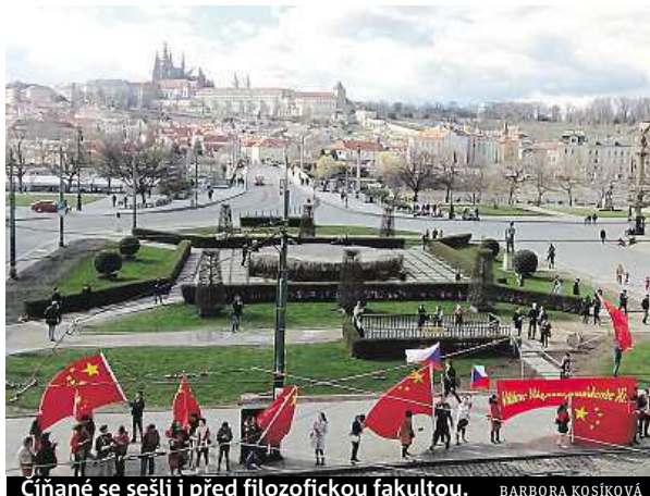
Číňané se sešli i před filozofickou fakultou.