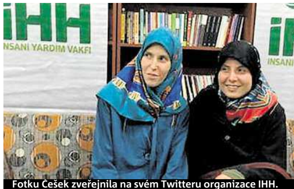
Fotku Češek zveřejnila na svém Twitteru organizace IHH.

„Platí ovšem, že český stát ani nevyjednává s teroristy, ani neplatí výkupné,“ řekl. Bývalý ministr zahraničí Karel Schwarzenberg (TOP 09) ovšem uvedl, že mnoho evropských států peníze únoscům tajně dává. V případě dvou Češek o tom prý ale raději ani vědět nechce. Zástupce IHH Izzet Sahín řekl, že není jasné, zda byli únosci napojeni na nějakou dobře známou organizaci. HOŘA ČTK