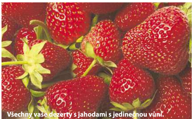
Všechny vaše dezerty s jahodami s jedinečnou vůní.