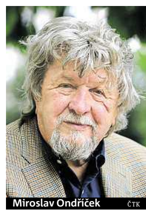
Miroslav Ondříček

Mezi Ondříčkovy velké lásky patřil také fotbal a hlavně pražská Slavia. Na přelomu století byl dokonce předsedou představenstva klubu. „Pane Ondříčku, děkujeme za vaši přízeň, nikdy nezapomeneme. Zůstáváte v našich srdcích,“ uvedla Slavia na