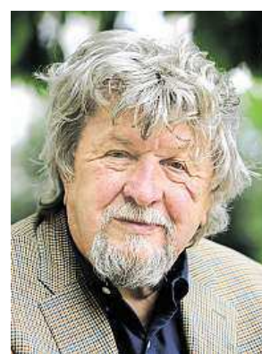
Miroslav Ondříček

Mezi Ondříčkovy velké lásky patřil také fotbal a hlavně pražská Slavia. Na přelomu století byl dokonce předsedou představenstva klubu. „Pane Ondříčku, děkujeme za vaši přízeň, nikdy nezapomeneme. Zůstáváte v našich srdcích,“ uvedla Slavia na