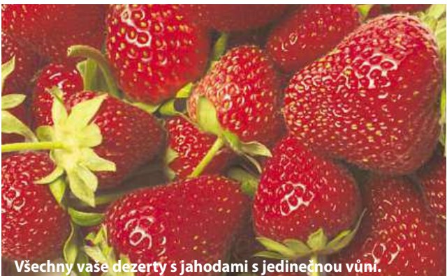
Všechny vaše dezerty s jahodami s jedinečnou vůní.