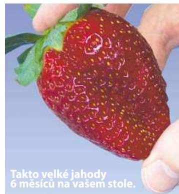
Takto velké jahody 6 měsíců na vašem stole.

Ano, nyní se již nepotřebujete ohýbat, abyste sbírali na zemi a v blátě jahody, které napadli živočichové ještě předtím, než byly zralé.