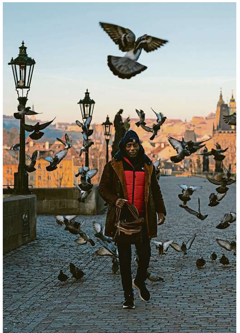
Ráno na Karlově mostě

NÁVŠTĚVY PO TELEFONICKÉ DOHODĚ 602 229 348 sberatelskykabinet@post.cz