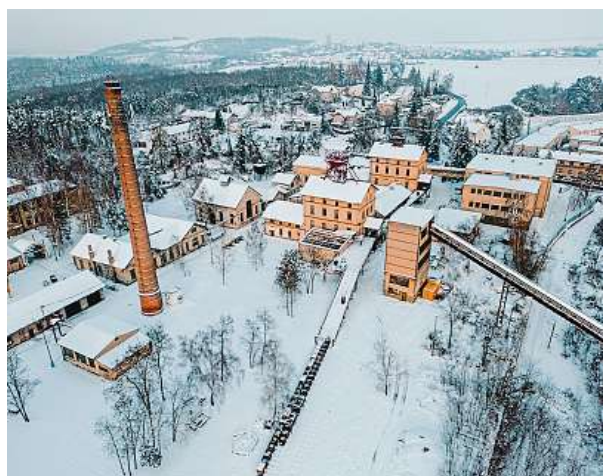
Hornický skanzen Mayrau

Hrad, který se tyčí nad řekou Sázavou, je více než sedm stovek let sídlem české šlechtické rodiny Sternbergů. Ačkoliv navenek může hrad působit stroze, ukrývá v sobě nádherně zdobené a bohaté komnaty. V průběhu zimních měsíců nabízí komentované prohlídky svého jedineho okruhu, a to vždy od pátku do neděle v časech 11, 12.30 a 14 hodin nebo od pondělí do čtvrtka pouze na objednávku. MET