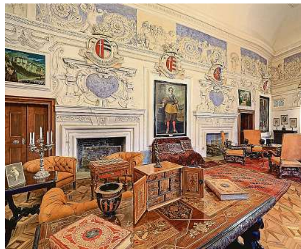
Hrad Český Šternberk

V neděli provoní sázavské náměstí Voskovce a Wericha zabijačkové hody pod širým nebem. Ochutnat můžete jitrnice, jelita, prejt, tlačenu, prdelačku nebo ovar. Těšte se na dobroty z udíren jako klobásy, špekly nebo uzené šunky. Zahřejte se svařeným vínem nebo třeba horkou čokoládou. Sladkou tečkou budou kynuté buchty, koláče a trdelník. Uvidíte, jak se plní jitrnice, poslechnete si harmonikáře a pro děti budou připraveny dílničky.