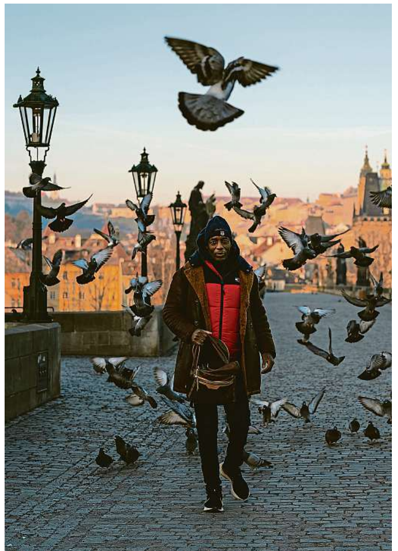
Ráno na Karlově mostě

NÁVŠTĚVY PO TELEFONICKÉ DOHODĚ 602 229 348 sberatelskykabinet@post.cz