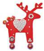
Brož Deers Olga Menzelová 990 Kč