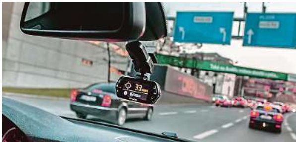
Kamera může snímat dění před vozem, ale také poskytovat některé údaje o provozu na silnici.

Vypovídají o tom například záznamy kamer, které si stále víc automobilistů instaluje na palubní desku nebo je mají přímo integrované ve zpětném zrcátku na čelním skle. „Najížděl jsem do poslední zatáčky, měl jsem to k domu asi pět set metrů. A právě v té poslední zákrutě byla pod sněhem na