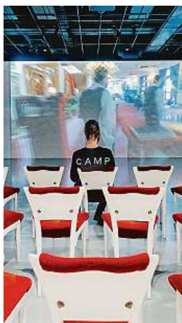
Součástí výstavy je projektce i židle zvané Olga.

Expozice je koncipována jako mnohovrstevnaté vyprávění. „Návštěvníci výstavy se setkají s ikonickými stavbami, objekty i drobnými detaily – od slavnostních židlí Olga od Bořka Šípka, které původně navrhl pro Kancelář prezidenta republiky na Pražském hradě, přes dobovou inzerci, časopisy až po ironický pohled na dějiny devadesátých staveb od Radka Štěttra Úlehlly,“ říká Štěpán Bártl, vedoucí CAMP.