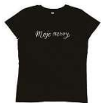
Tričko Moje nervy Dva tátové 450 Kč