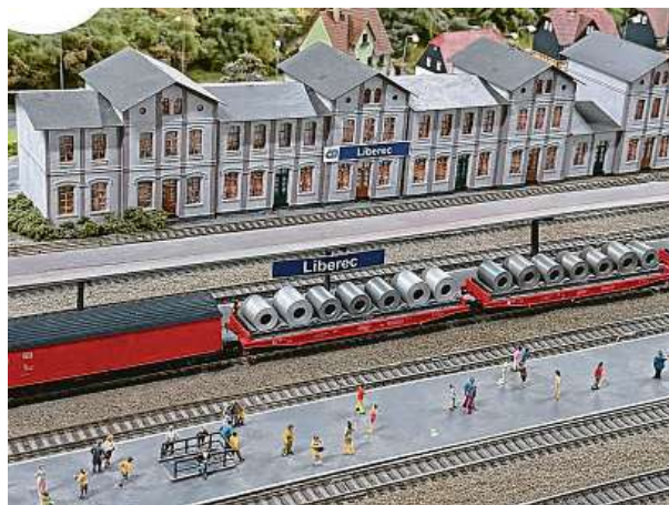
Šest set metrů čtverečních modelového kolejiště najdete v Praze na Andělu. Více na království-zeleznic.cz .