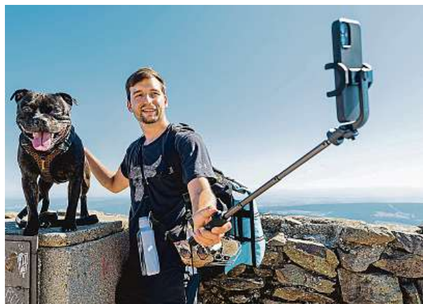
Mobily nejen vytlačují fotoaparáty. Také odstartovaly fotografování selfieček a především obrázky a videa na výšku.