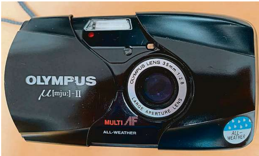
Kdo neměl mjučko, ten jako by nebyl. Kompaktní fotoaparát na kinofilm z roku 1991 vzali na milost také skalní profesionálové. Byl jednoduše ovladatelný a nevidil mu děst, vážil 135 gramů.

Byznys to byl i pro minila-by, protože začalo fotografovat stále větší množství lidí. Tedy i ti, kteří by si předtím na štelování clony a času u zrcadlovky netroufli. Kompaktním ale přišli v devadesá-