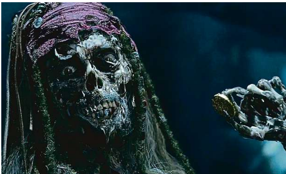
Gore Verbinski režíroval první tři filmy ze série Pirátů z Karibiku. Na fotce výše je vidět Johnny Depp jako Jack Sparrow, který se v prvním snímku dočasně proměnil v nemrtvého.

„Jde o to, co se z pohledu producentů a vedení stalo ‚přijatelným‘. Mají pocit, že nikomu nebude vadit, když lodě na moři vypadají, jako by vlastně nebyly na vodě. U prvních Pirátů z Karibiku jsme skutečně vyplouvali na moře a byli na opravdové