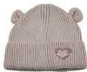
Dětská čepička Renata Langmannová 390 Kč