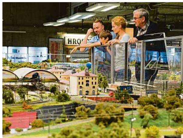
3x KRÁLOVSTVÍ ŽELEZNIC