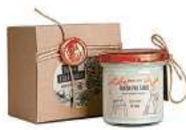
Přírodní svíčka Oskar Hes 590 Kč