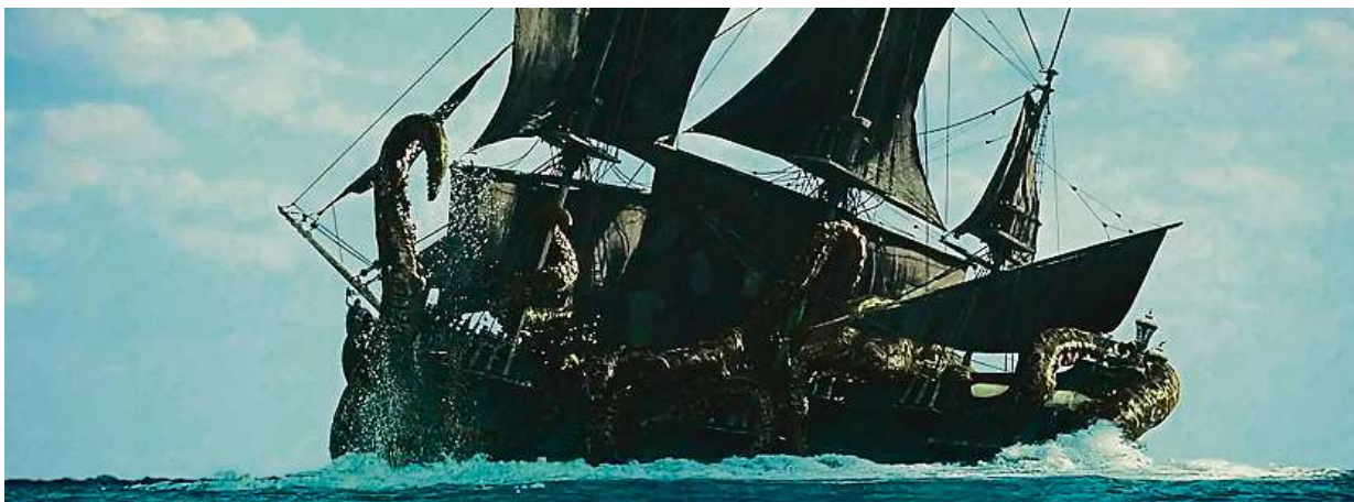
Hlavní záporák Davy Jones (Bill Nighy) je považován za jednoho z nejlépe zestárých charakterů vytvořených na počítači vůbec. Chapadla, jež měl na obličej, reagovala na gravitaci, vodu i kontakt s herci. Výše vidíme loď, kterou se chystá pozřít bájná mořská obluda – Kraken.