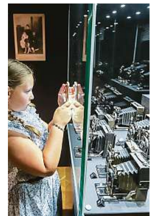
Mobil z 21. století fotí měchové aparáty z počátku 20. století.