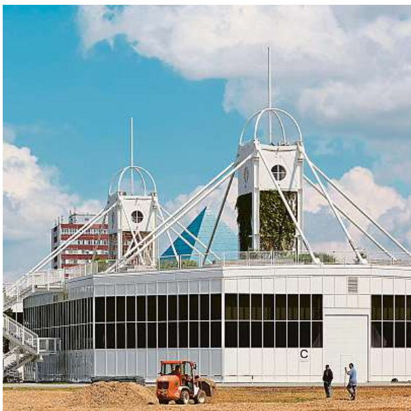
Výstaviště navrhl architekt Michal Brix. Projekt vznikl v srpnu 1990. Realizace probíhala od října 1990 až do května 1991. 2x RADEK Š. ÚLEHLA