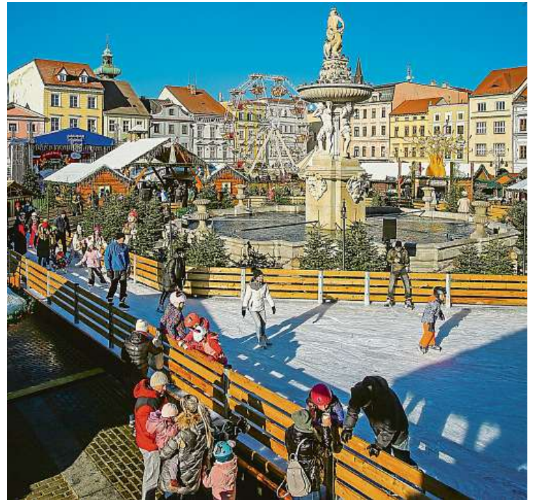
Na českobudějovickém náměstí Přemysla Otakara II. se bruslilo už v listopadu.

Fond ohrožených dětí – charitativní spolek pomáhá již od roku 1990 týraným, zneužívaným, zanedbávaným, opuštěným či jinak sociálně znevýhodněným dětem. Je zřizovatelem Klokánku, zařízení pro děti vyžadující okamžitou pomoc, kterých aktuálně provozuje 14 po celé ČR. Od roku 2000 v nich pomohl již více než 12 758 dětem a aktuálně má v péči více jak 200 dětí. www.fod.cz