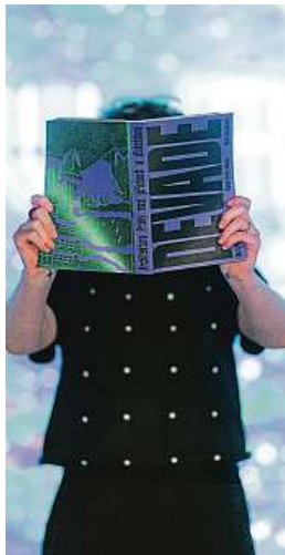
Devadesátkám se věnuje i stejnojmenná kniha.