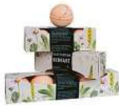
Koupelové koule Manufaktura 200 Kč