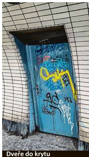
Dveře do krytu

Pokud by Prahu skutečně postihla jaderná katastrofa, teoreticky je možné uzavřít nejen kryt, ale i pěší tunel po celé jeho délce. K tomu slouží mohutná kulatá vrata, která by tu obyvatele hermeticky