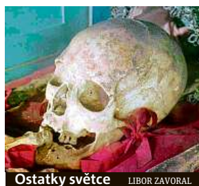
Ostatky světce

Česko se chystá na letošní světovou výstavu Expo, která se v říjnu uskuteční v Dubaji. Představí se tam také lázeňská města. Například město Teplice se bude prezentovat lebkou křesťanského mučedníka a patrona lázeňství svatého Clariho. Ostatky jsou uloženy v chrámu Povýšení sv. Kříže. Lebka bude součástí lázeňské kolonády. Svatý Clari žil zhruba ve čtvrtém století v Dalmácii a byla mu prisuzována zázračná schopnost