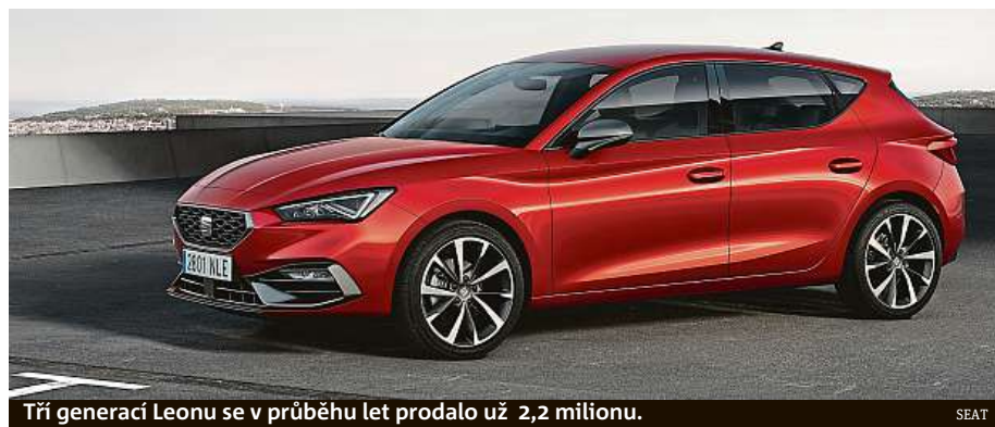
Tři generací Leonu se v průběhu let prodalo už 2,2 milionu.

Leon je postaven na platformě MQB Evo, v pětidveřové verzi má na délku 4368 mm, jako kombík pak 4642 mm. Ceny nejsou dosud známy, do Česka přijde v létě. HOP