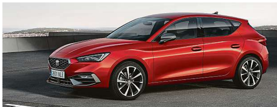
Tři generací Leonu se v průběhu let prodalo už 2,2 milionu.

Leon je postaven na platformě MQB Evo, v pětidveřové verzi má na délku 4368 mm, jako kombík pak 4642 mm. Ceny nejsou dosud známy, do Česka přijde v létě. HOP