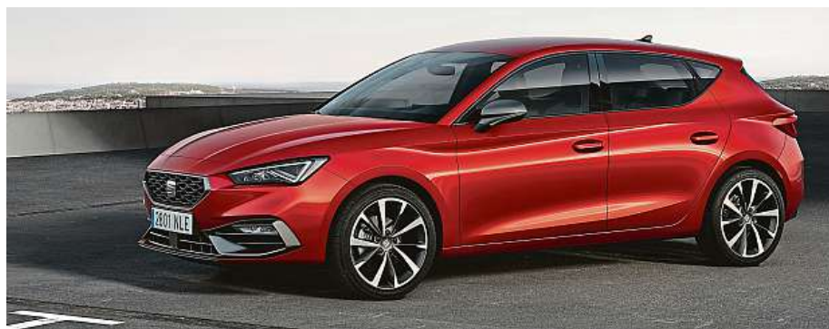
Tři generací Leonu se v průběhu let prodalo už 2,2 milionu.

Leon je postaven na platformě MQB Evo, v pětidveřové verzi má na délku 4368 mm, jako kombík pak 4642 mm. Ceny nejsou dosud známy, do Česka přijde v létě. HOP