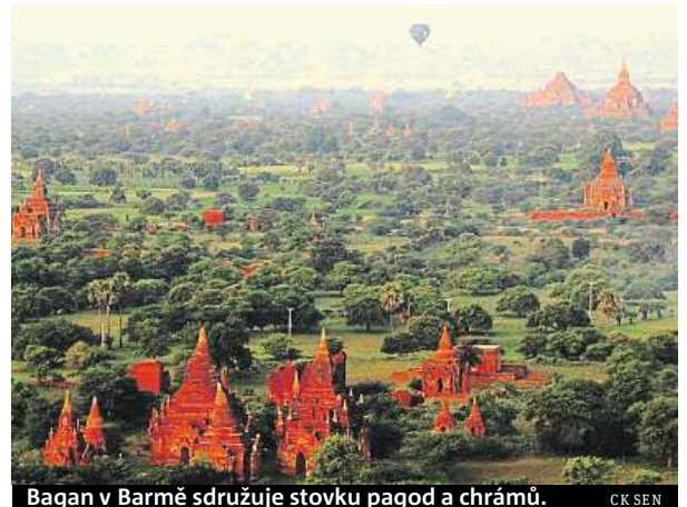
Bagan v Barmě sdružuje stovky pagod a chrámů. CK SEN

Monumentální pomník v Agře dal v letech 1632 až 1654 vystavět mogul Šáhdžahán na památku své předčasně zesnulé ženy. Je postaven z mramoru, povrch je zdoben polodrahokamy, drahokamy a kaligrafická výzdoba je provedena černým mramorem. Komplex zaujímá 17,5 hektaru a samotné mauzoleum stojí na čtvercovém podstavci, jehož rohy zdobí čtyři čtyřicetimetrové minarety.