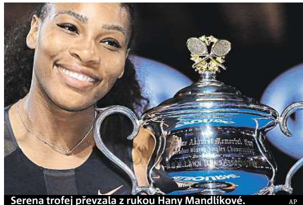
Serena trofej převzala z rukou Hany Mandlíkové.