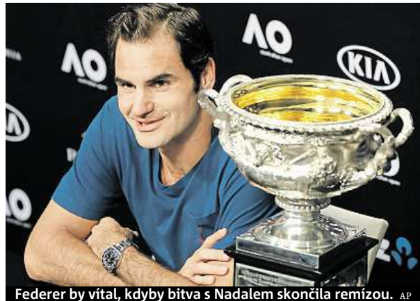
Federer by vítal, kdyby bitva s Nadalem skončila remízou.

Letošní Australian Open má také jednu českou vítězku. Lucie Šafářová vyhrála ženskou čtyřhru. Stejně jako předloni kralovala ve dvojici s Američankou Bethanií Mattekovou-Sandsovou.