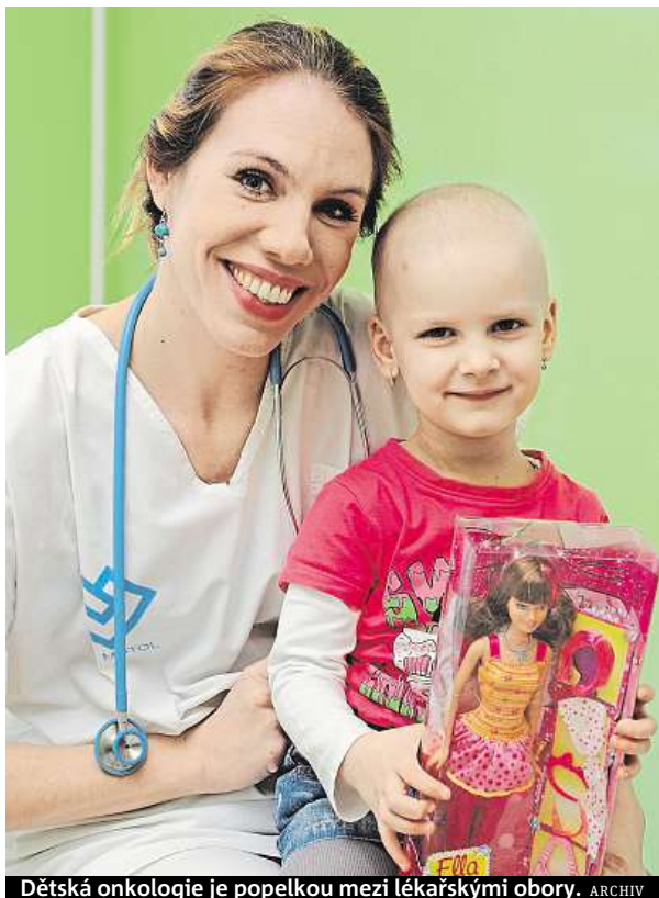
Dětská onkologie je popelkou mezi lékařskými obory.

„Před rakovinou zavírají lidé oči a bojí se jí,“ říká dětská onkoložka.