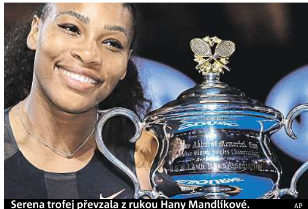
Serena trofej převzala z rukou Hany Mandlíkové.