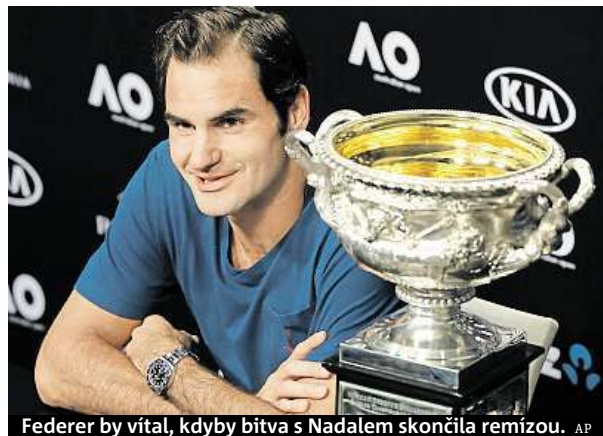
Federer by vítal, kdyby bitva s Nadalem skončila remízou.

Letošní Australian Open má také jednu českou vítězku. Lucie Šafářová vyhrála ženskou čtyřhru. Stejně jako předloni kralovala ve dvojici s Američankou Bethanií Mattekovou-Sandsovou.