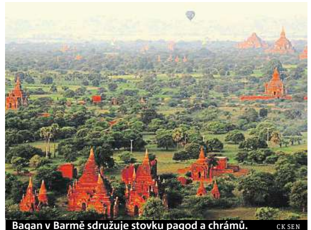
Bagan v Barmě sdružuje stovky pagod a chrámů. CK SEN

Monumentální pomník v Agře dal v letech 1632 až 1654 vystavět mogul Šáhdžahán na památku své předčasně zesnulé ženy. Je postaven z mramoru, povrch je zdoben polodrahokamy, drahokamy a kaligrafická výzdoba je provedena černým mramorem. Komplex zaujímá 17,5 hektaru a samotné mauzoleum stojí na čtvercovém podstavci, jehož rohy zdobí čtyři čtyřicetimetrové minarety.