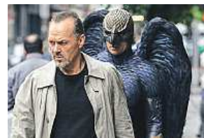
Karel Roden ve filmu Fotograf (vlevo). Po stopách zločinu se vydá Jake Gyllenhaal (Slídil). Do kin jdou i filmy Miluj souseda svého a Birdman (vpravo dole).