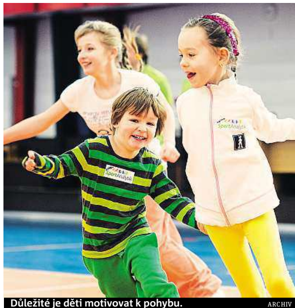
Důležité je děti motivovat k pohybu.

„Cílem programu není jen vybrat konkrétní sport, ale také namotivovat děti k pohybu a fyzické aktivitě, což je v současné době více než třeba,“ doplňuje Jahoda. Testuje se v celé republice, v Praze, Brně, Olomouci, ale i Zlíně nebo Sezimově Ústí. ROW