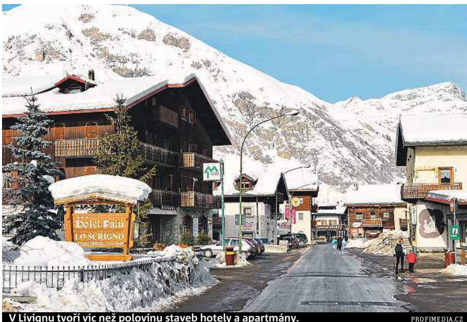
V Livignu tvoří víc než polovinu staveb hotely a apartmány.

Zejména v předvánočním čase, kdy je celá pěší zóna vyzdobena různými světýlky a vánočními motivy, je v této části Livigna vpoledve velmi rušno. Člověka, který zde