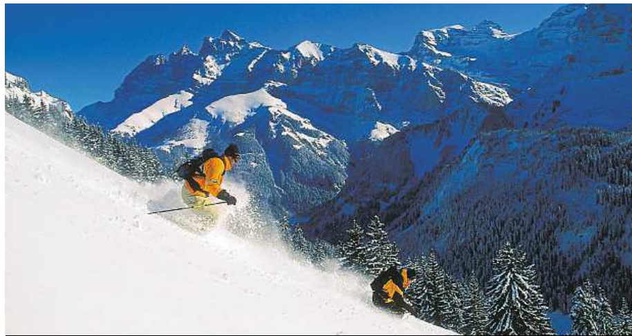
Lyžování ve švýcarském Portes du Soleil