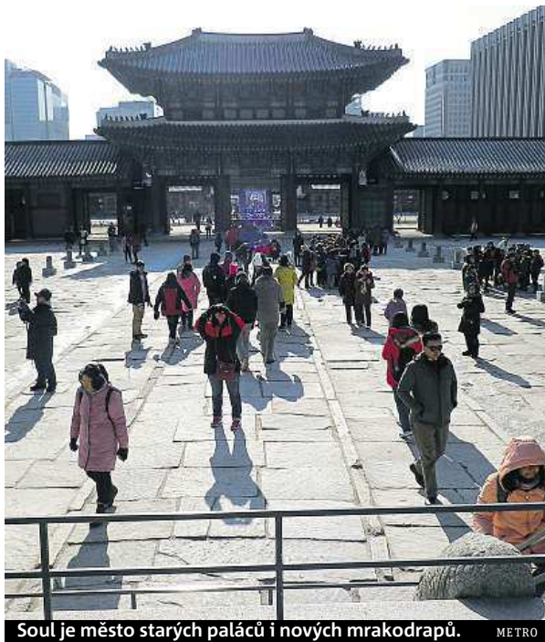
Soul je město starých paláců i nových mrakodrapů. METRO

Po Soulu se nejlépe cestuje metrem, má devět tras a více