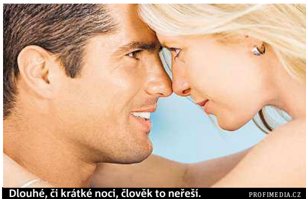
Dlouhé, či krátké noci, člověk to neřeší.

Jenže údaje statistického úřadu tomu moc nenapovídají. Podle nich se nejvíce dětí v Česku rodí v období od května až zhruba do září. Zatímco v ostatních měsících se porodnost pohybuje pod hranicí devíti tisíc, v tomto období ji