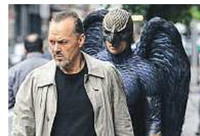
Karel Roden ve filmu Fotograf (vlevo). Po stopách zločinu se vydá Jake Gyllenhaal (Slídil). Do kin jdou i filmy Miluj souseda svého a Birdman (vpravo dole). PR