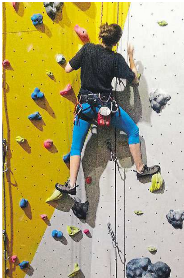
Nahoru po žluté

Slevy na lezení mívají studenti, někde senioři. Ušetřit můžete při nákupu permanentky. JOSEF ŠKVOR