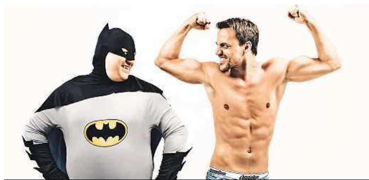
Hodně se půjčují i kostýmy Batmana.