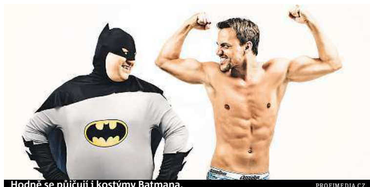
Hodně se půjčují i kostýmy Batmana.