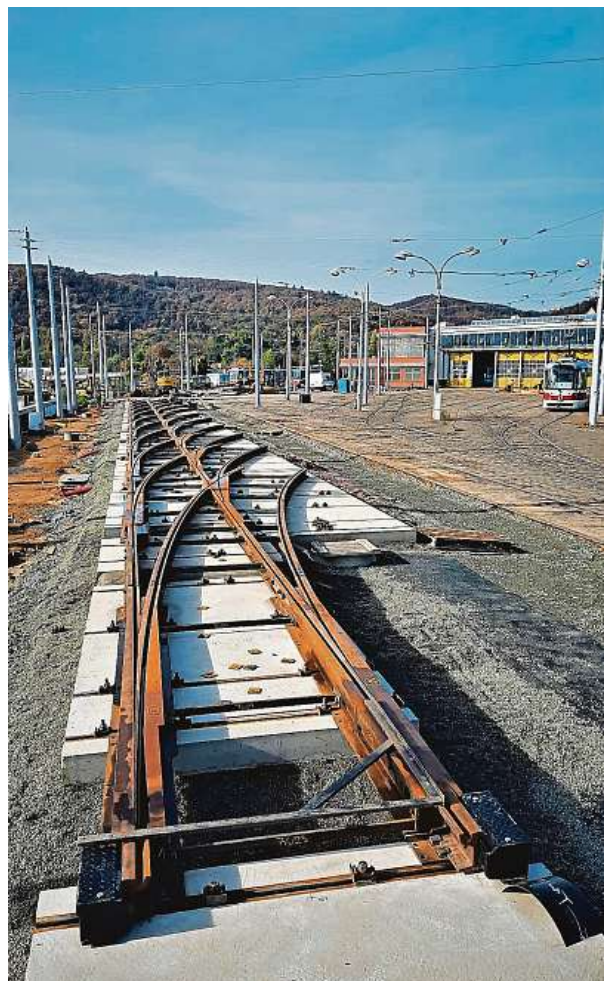
Patnáct kolejí se seběhne do jedné.

Stavba probíhá za provozu. Kvůli ní se urychlila i likvidace některých vozů.