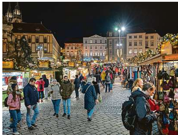
Advent na Zelňáku