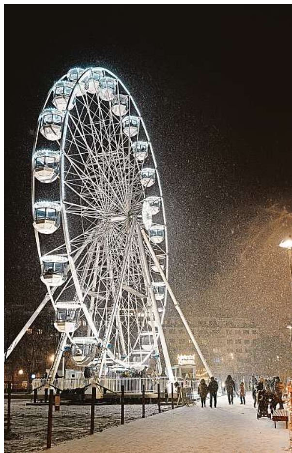
Kolo v parku na Moravském náměstí