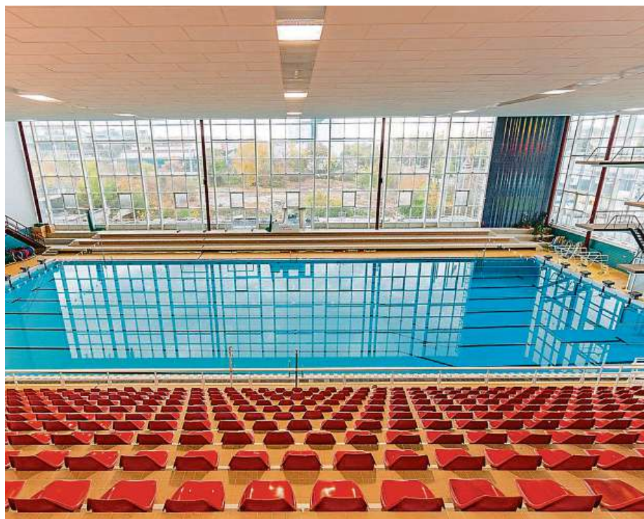
Hodina a půl plavání mezi šestou a čtrnáctou hodinou a následně mezi osmou a půl desátou hodinou večerní vyjde v Lužánkách na 160 korun.

Hodina a půl plavání mezi šestou a čtrnáctou hodinou a následně mezi osmou a půl desátou hodinou večerní vyjde v Lužánkách na 160 korun. Odpolední vstupné je o dvacetikorunu dražší. K dispozici jsou i různé slevy či rodninné vstupné. RADEK BABIČKA