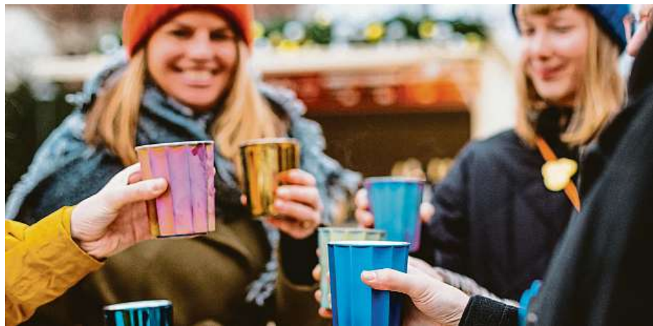
Kelímky na adventní nápoje hrají všemi barvami.