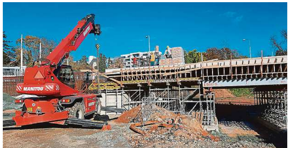
Stavba tramvajové smyčky probíhá za provozu.