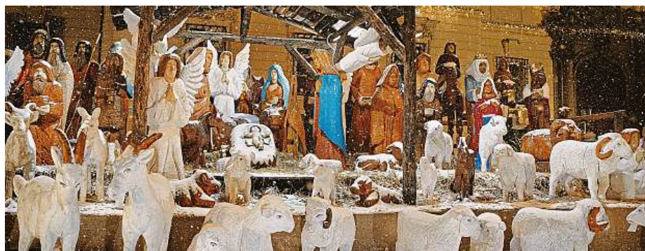
Betlém na Dominikánském náměstí