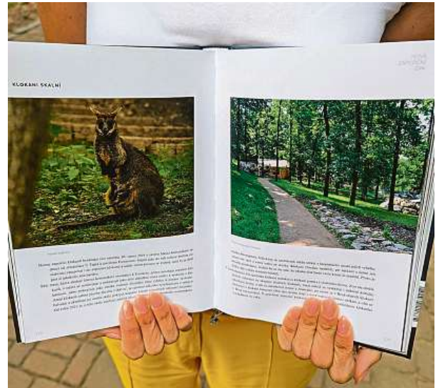
Kniha je plná fotek a zajímavých textů.