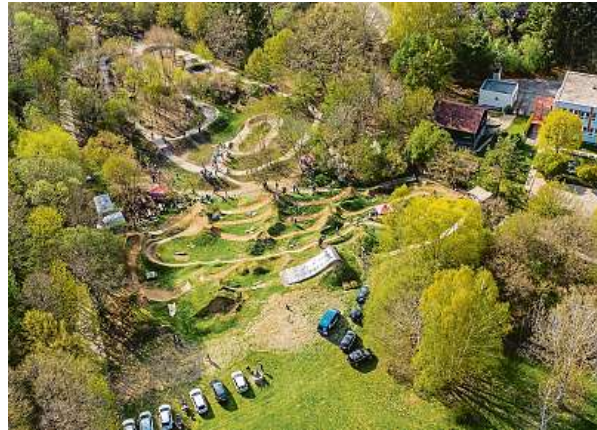
Sportovní areál pod Pekárnou, jedno z míst, o jehož podobě mohou rozhodnout obyvatelé Brna.

Obyvatelé Brna už posedmé vybírají v projektu Dáme na vás, které větší i menší vize se v příštích třech letech díky městským penězům promění ve skutečnost. Nové hřiště, sportoviště nebo zelené plochy, ale také třeba komunitní centrum pro seniory nebo holubník. Nápady spojené s využitím dětí nebo s dopravní infrastrukturou. O přízeň a hlavně hlasy lidí se uchází celkem 56 různorodých projektů, které prošly cestou od podání nápadu a sběru první vlny podpory na jaře až po posouzení proveditelnosti úředníky. Každý projekt je limitován částkou pět milionů korun a celkové vyhrazené prostředky činí pětadvacet milionů korun.