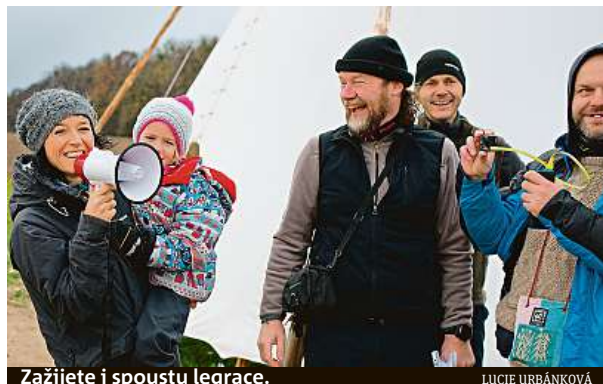
Zažijete i spoustu legrace.