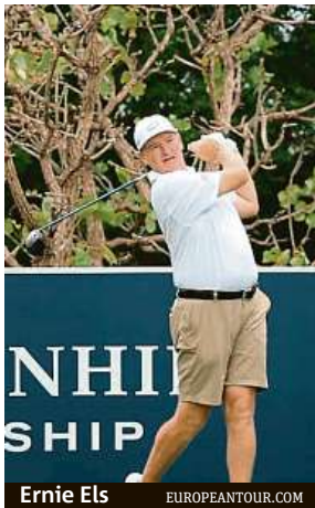
Ernie Els

Golfisté mohou na European Tour poprvé odložit dlouhé nohavice. Hraje se totiž v Jihoafrické republice.