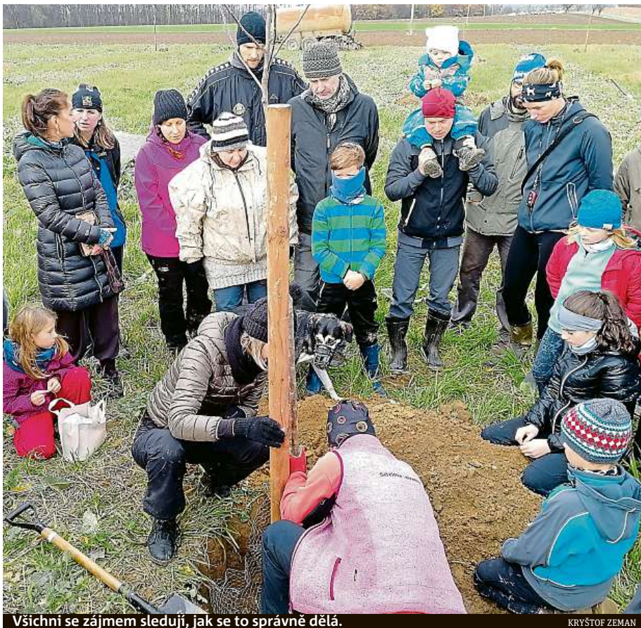
Všichni se zájmem sledují, jak se to správně dělá.

Jedním z posledních podzimních projektů bylo založení Lučního sadu u Slavkova na Opavsku. Jde o dvouhektarový pozemek, který je rozdělen na tři části. „Jedna třetina je školní, druhá je komunitní, kde se zapojují jednotliví