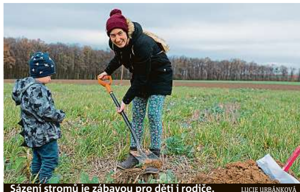
Sázení stromů je zábavou pro děti i rodiče.