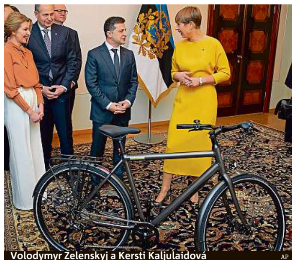
Volodymyr Zelenskij a Kersti Kaljulaidová

„Obvykle se na státní úrovni dává něco jedinečného. Třeba štěně,“ zažertoval jeden z diskutujících na internetu ve zjevně narážce na ruského prezidenta Vladimira Putina, který vzhledem k pověsti milovníka přírody a zvířat byl štěnětem obdarován již několikrát. ČTK