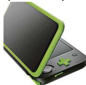
Akce s Nintendem 2x MIRONET

Mnoho dalších produktů zařazených do akce Nintendo Black Friday najdete, když do vyhledávací internetového obchodu Mironet zadáte heslo „nintendobf2019“.