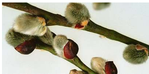
Jedním z nejdůležitějších hormonů rostlin je auxin.

Stejně jako lidé, také rostliny mají své hormony.