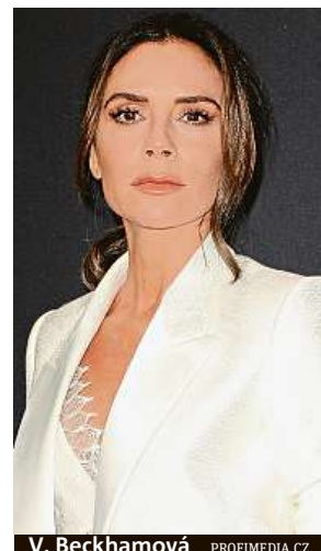
V. Beckhamová

V loňském roce vykázala módní značka Victoria Beckhamové opět ztrátu, neboť poptávka po luxusním oblečení bývalé zpěvačky dívčí skupiny Spice Girls stagnuje. Společnost Victoria Beckham Limited nevykázala zisk od svého založení v roce 2008 a loni její ztráta činila 12,3 milionu liber (369,3 milionu korun). Svoji značku poprvé představila v roce 2008 kolekcí luxusních oděvů. Nyní prodává značkové oblečení a doplňky ve více než 400 obchodech po celém světě. Beckhamová většinou za svůj styl oblékání sklízí pochvalné kritiky, její módní značka se však potýká s finančními těžkostmi. ČTK