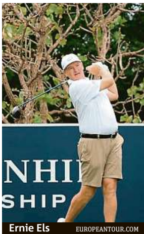
Ernie Els

„Mluví se o tom po celém světě už dlouho,“ komentoval rozhodnutí, které je označováno jako průlomové, slavný jihoafrický golfista Ernie Els. „Myslím, že náš sport to může jen obohatit,“ dodal vítěz čtyř majorů.