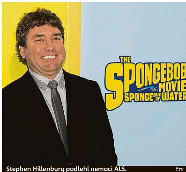
Stephen Hillenburg podlehl nemoci ALS.

ALS je zkratka pro amyotrofickou laterální sklerózu,