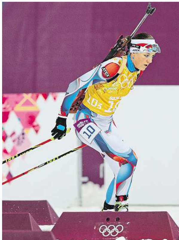
Jitka Landová při olympijské štafetě v Soči v roce 2014

Olympijský výbor letos už dodatečně udělil bronzové medaile zápasníkovi Marku Švecovi za hry v Pekingu 2008 a oštěpaři Vítězslavu Veselému z olympiády v Londýně 2012. Také oni dostali dodatečnou finanční odměnu od Českého olympijského výboru. „Možná bychom do budoucna měli v rozpočtech na odměny počítat s vyššími částkami kvůli těmto důvodům,“ dodal Doktor s úsměvem. ČTK