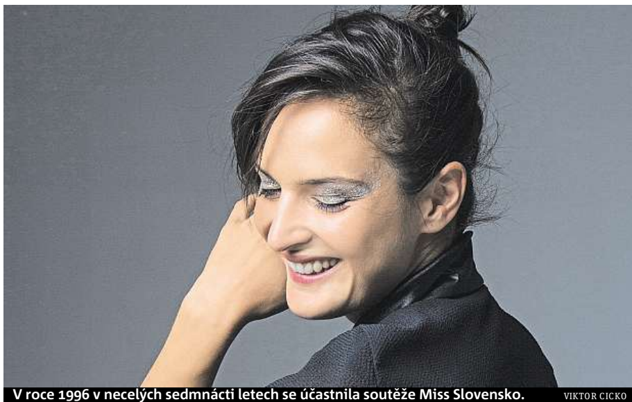
V roce 1996 v necelých sedmnácti letech se účastnila soutěže Miss Slovensko .

Každý interpret by měl mít v portfoliu takové album. Je však důležité k němu dospět. Být připraven na to, že váš hlas nebude vždy stoprocentní a dokonalý. Takový je život. Protože Živá je nahrávka z vícero turné a koncertů, o to více je možné, že se kvalitou jednotlivých nahrávek bude lišit. Nešlo nám však o žádnou vyleštěnou dokonalou live nahrávku, ale spíše o dokument, který přináší jakýsi průřez mou tvorbou a kromě těch posledních písní z Moruše nabídne i písně