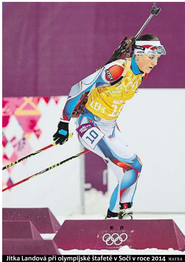
Jitka Landová při olympijské štafetě v Soči v roce 2014 MAPRA

Olympijský výbor letos už dodatečně udělil bronzové medaile zápasníkovi Marku Švecovi za hry v Pekingu 2008 a oštěpaři Vítězslavu Veselému z olympiády v Londýně 2012. Také oni dostali dodatečnou finanční odměnu od Českého olympijského výboru. „Možná bychom do budoucna měli v rozpočtech na odměny počítat s vyššími částkami kvůli těmto důvodům,“ dodal Doktor s úsměvem. ČTK