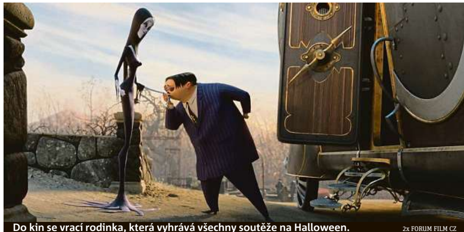
Do kin se vrací rodinka, která vyhrává všechny soutěže na Halloween.