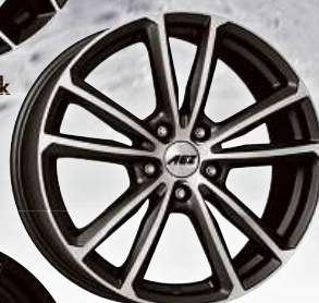
AEZ Tioga titan