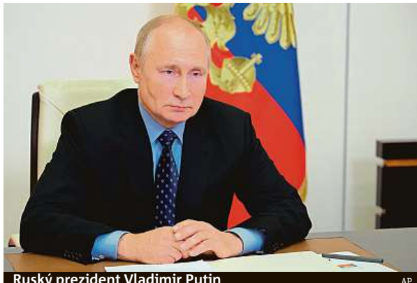
Ruský prezident Vladimir Putin

Ruský prezident Vladimir Putin nařídil zvednout dodávky zemního plynu do Evropy od listopadu. Státní podnik Gazprom s nimi má začít, až naplní domácí podzemní zásobníky. Informovala o tom agentura TASS. Na starém kontinentě je před příchodem zimy napjatá situace na trhu s energiemi – ceny zemního plynu se od začátku roku zvýšily o 365 procent. Evropské představitelé požadují, aby Rusko dodávky zvýšilo, to ale zatím jen plnilo stávající dohody. Ředitel Gazpromu Alexej Miller Putinovi sdělil, že firma by mohla zvýšit dodávky do Evropy po 8. listopadu. Miller také na zasedání vlády přenášeném televizi