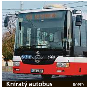
Kníratý autobus ROPID

Polepením masek svých dopravních prostředků černými kníry se dopravní podnik letos opět zapojuje do celosvětové kampaně Movember. Ta podporuje zdraví mužů a prevenci rakoviny varlat či prostaty.