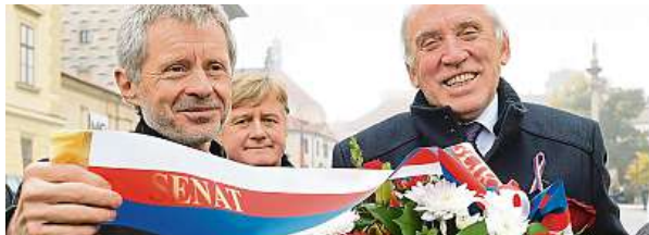
Klaus v Mlýnském Pražském hradu. Akce se uskutečnila také u sochy T. G. Masaryka, kam přišli mimo jiné senátoři.