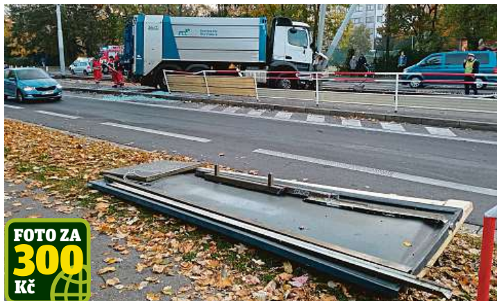
FOTO ZA 300 KČ

Zlatnictví Sherri najdete v přízemí pasáže Černá růže v centru Prahy. Adresa je Na Příkopě 853/12, Praha 1.