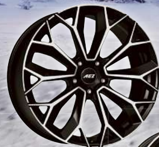
AEZ Leipzig dark

Kvalitní litá kola vhodná pro zimní provoz za akční ceny v originálních rozměrech nebo s Typovým listem!