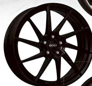
DOTZ Spa black