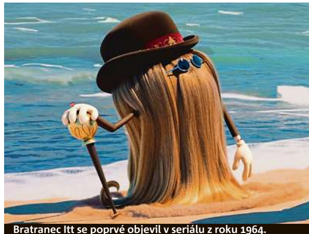
Bratranec Itt se poprvé objevil v seriálu z roku 1964.

Černohumorná, patřičně svérázná a sympaticky morbidní familie je nejen pro české diváky klasikou.