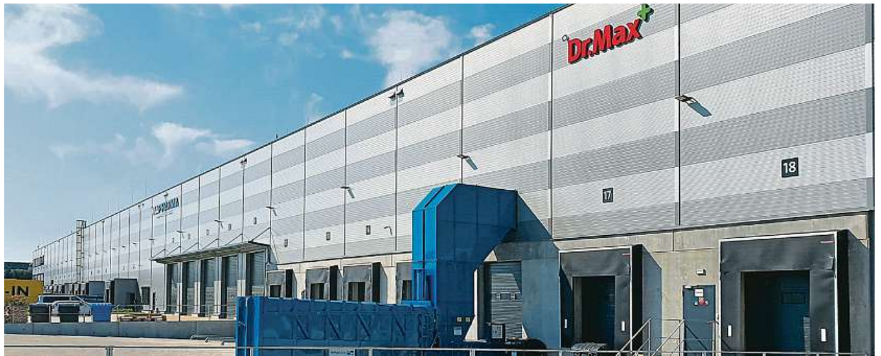
Nový sklad Dr.Max v Pavlově na Kladensku obsluhuje tradiční lékárny i e-shop

K patnáctiletému výročí existence značky si největší tuzemská síť lékáren, Dr.Max, nadělila nejmodernější logistickou lékárenskou základnu v republice. Stojí v Pavlově u Prahy.