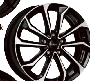
DEZENT KS dark