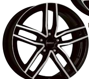
DEZENT TR dark