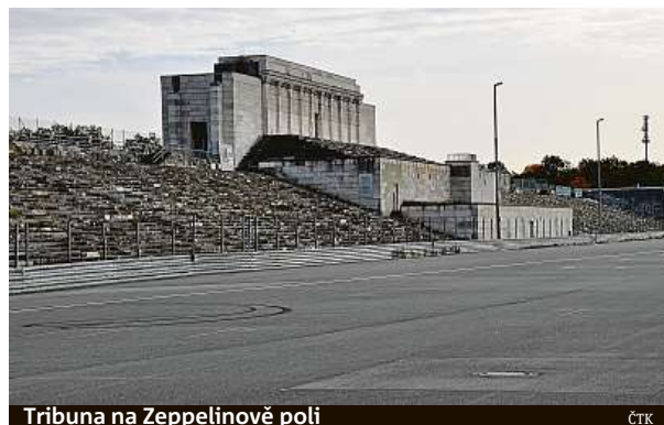
Tribuna na Zeppelinově poli

Místo, kde kdysi davy nadšeně vzdávaly hold Hitlerovi, ročně navštíví přes 300 tisíc