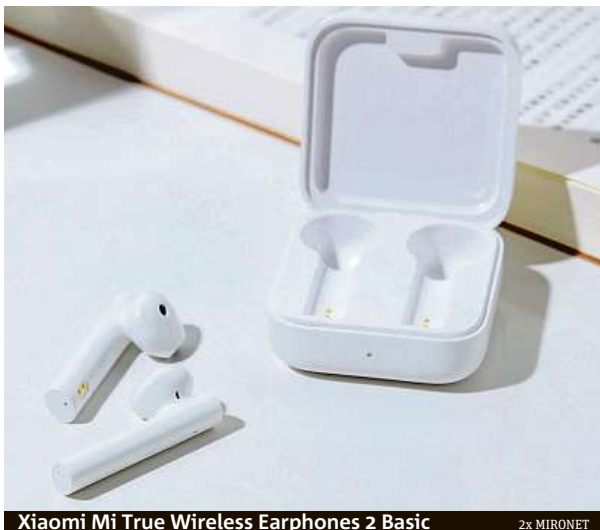
Xiaomi Mi True Wireless Earphones 2 Basic 2x MIRONET

Pokud tedy zrovna nechcete investovat do pohodlí pět tisíc korun, výběr byl ještě donedávna mizerný. Nyní ale díky značce Xiaomi je těmto dnům konec. Jejich Xiaomi