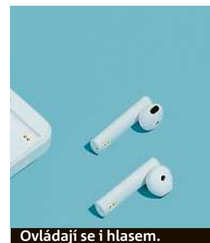
Ovládají se i hlasem.