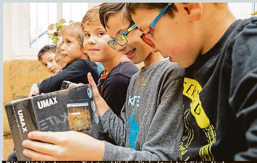
Děti z dětského domova v Tisé si prohlížejí počítače, které dostali jako dárek.

Opilý cizinec v noci na včerejšek havaroval na Pardubicku s nákladní soupravou naloženou osmi novými automobily. Řidič z nehody vyvázl bez zranění. Zřejmě usnul a vjel mimo silnici do příkopu. Policie řidiči zjistila 2,52 promile alkoholu v dechu. ČTK