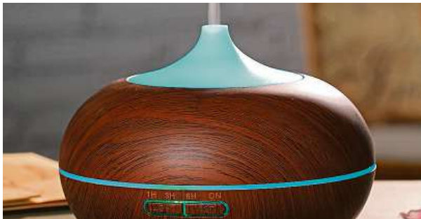
Difuzér Aromacare Zen a jeho plnění 2x MIRONET

Na pomoc přispěchá řešení v podobě aroma difuzéru, který nejenže naplní váš vzduch čerstvostí studené