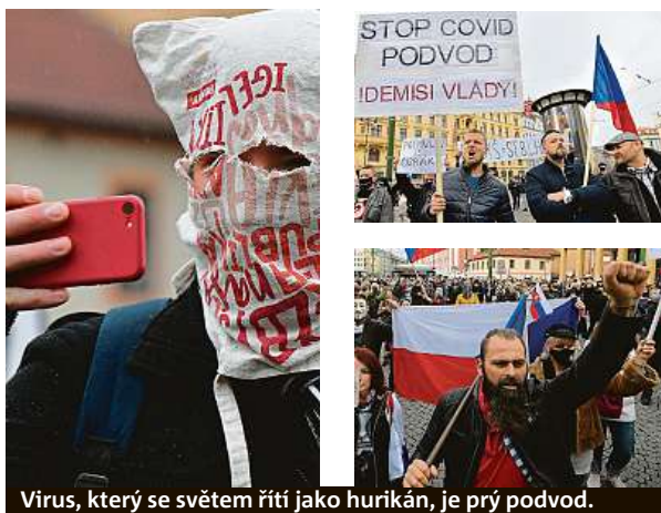
Virus, který se světem řítí jako hurikán, je prý podvod.