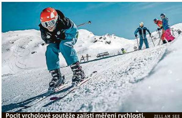
Pocit vrcholové soutěže zajistí měření rychlosti. ZELL AM SEE

Správnou atmosféru světového poháru nabídne