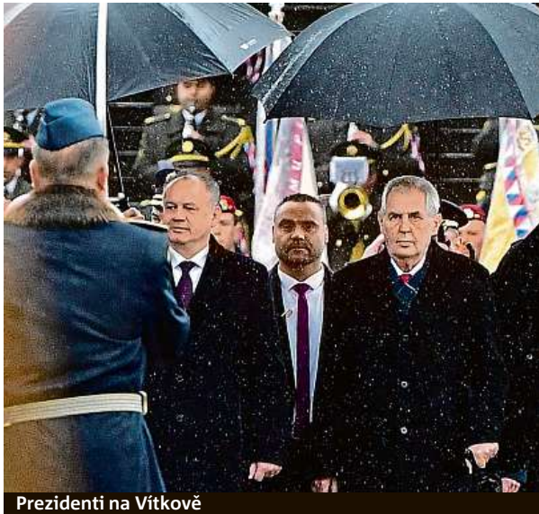
Prezidenti na Vítkově

Například v Ostravě si dorostenci fotbalového klubu Baník Ostrava oblékli do slavnostního průvodu dresy, které jejich předchůdci oblékali za první republiky. V celé zemi letos výrazně přibýlo soch prezidenta Osvoboditele, jednu odhalili například v Kostelci nad Orlicí na Rychnovsku a v krkonošském Studenci. Oslavy vyvrcholily večer na Pražském hradě, kde prezident republiky Miloš Zeman předal státní vyznamenání. PH A IDNES.CZ