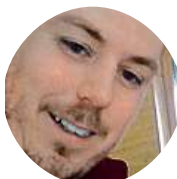
Kuba Glofák Zrušit!!! Prezidenti si vyznamenávají svoje kámoše!!!