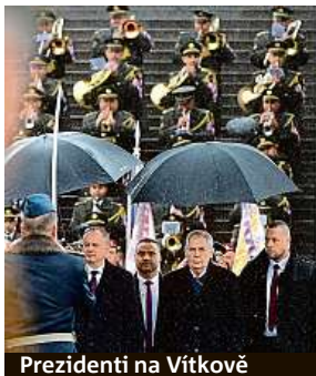
Prezidenti na Vítkově