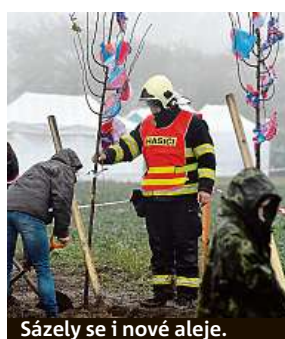
Sázely se i nové aleje.