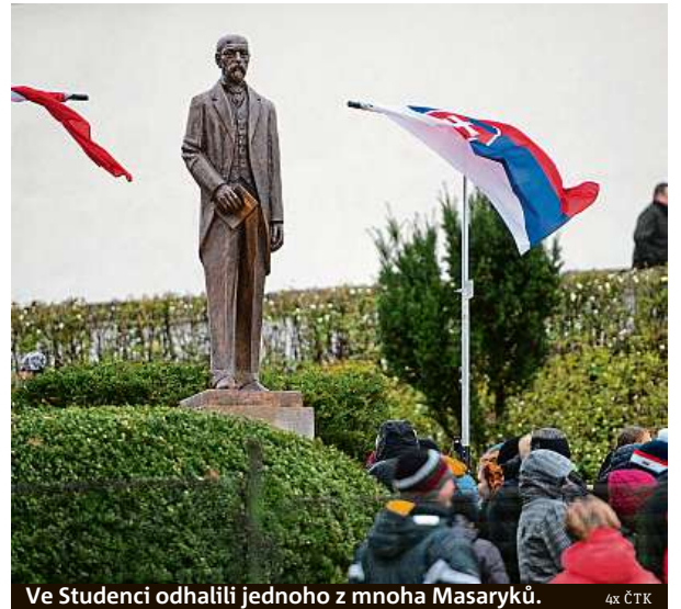
Ve Studenci odhalili jednoho z mnoha Masaryků.