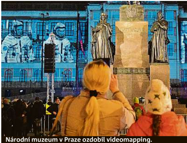
Národní muzeum v Praze ozdobil videomapping.

Například v Ostravě si dorostenci fotbalového klubu Baník Ostrava oblékli do slavnostního průvodu dresy, které jejich předchůdci oblékali za první republiky. V celé zemi letos výrazně přibýlo soch prezidenta Osvoboditele, jednu odhalili například v Kostelci nad Orlicí na Rychnovsku a v krkonošském Studenci. Oslavy vyvrcholily večer na Pražském hradě, kde prezident republiky Miloš Zeman předal státní vyznamenání. PH A IDNES.CZ