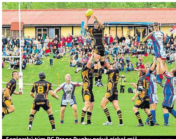
Seniorský tým RC Praga Rugby právě získal míč. RC PRAHA RUGBY