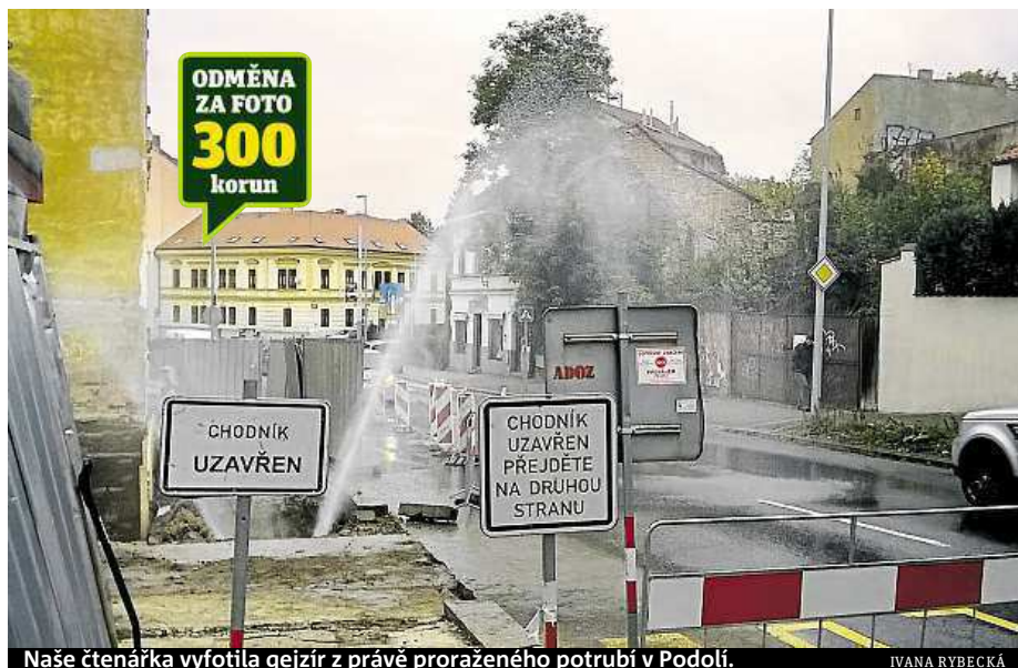
Naše čtenářka vyfotila gejzír z právě proraženého potrubí v Podolí.