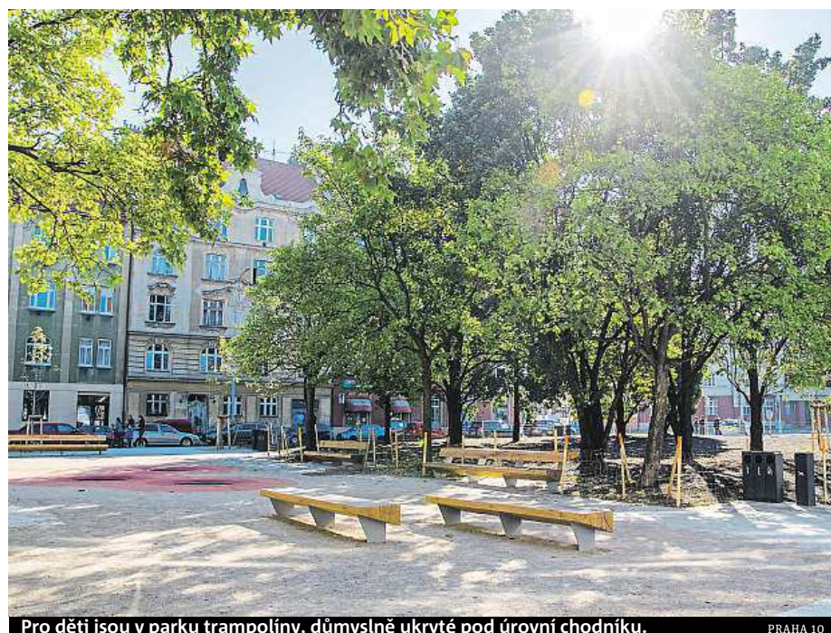
Pro děti jsou v parku trampolíny, důmyslně ukryté pod úrovní chodníku.