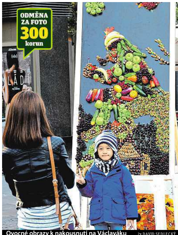
Ovocné obrazy k nakousnutí na Václaváku