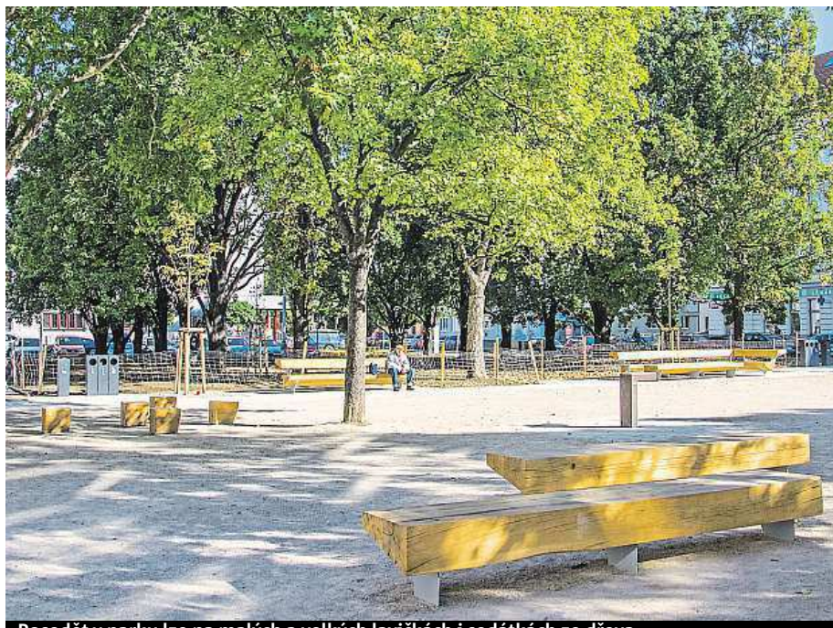
Posedět v parku lze na malých a velkých lavičkách i sedátkách ze dřeva.

Na podzim začala i rekonstrukce ulice za tři sta milionů, která se tak konečně dočká moderní tratě. Cestující ve Vršovicích se po opravě mohou těšit na tichou trať se spoustou moderních úprav. Část tratě bude zatravněná a budou na ní bezbariérové zastávky. row