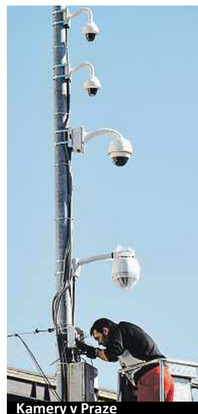
Kamery v Praze