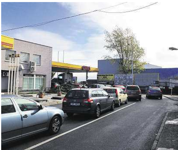
Dopravní kolony by nemusely vznikat, kdyby se řidiči řadili rovnoměrně ke všem čtyřem stojanům.

„Podle vodorovného dopravního značení nesmějí zů-