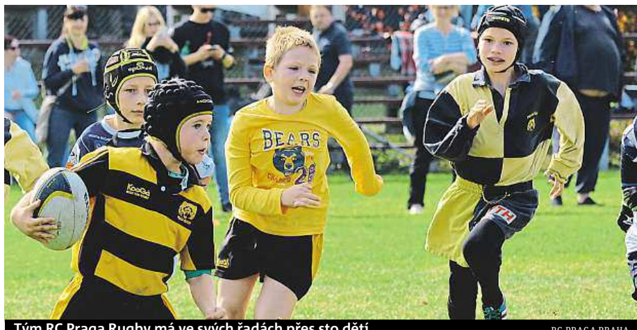
Tým RC Praga Rugby má ve svých řadách přes sto dětí. RC PRAGA PRAHA