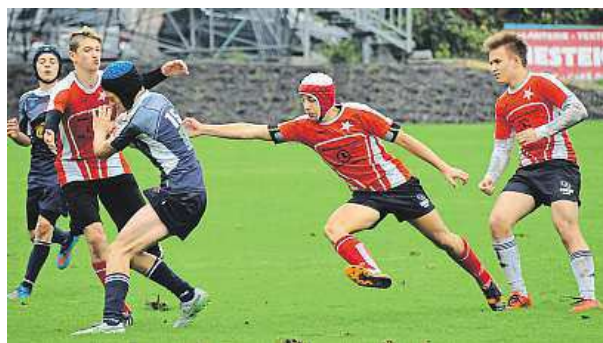
Hráči RC Slavia se snaží zastavit průnik Řičan.

ky i ti úplně nejmenší. „Rugbyová školka je kroužek, jehož cílem je u dětí hravou formou vypěstovat základní motorické a atletické návyky. Určena je pro děti už od tří let,“ nabízí ragby i malým dětem Čížek.