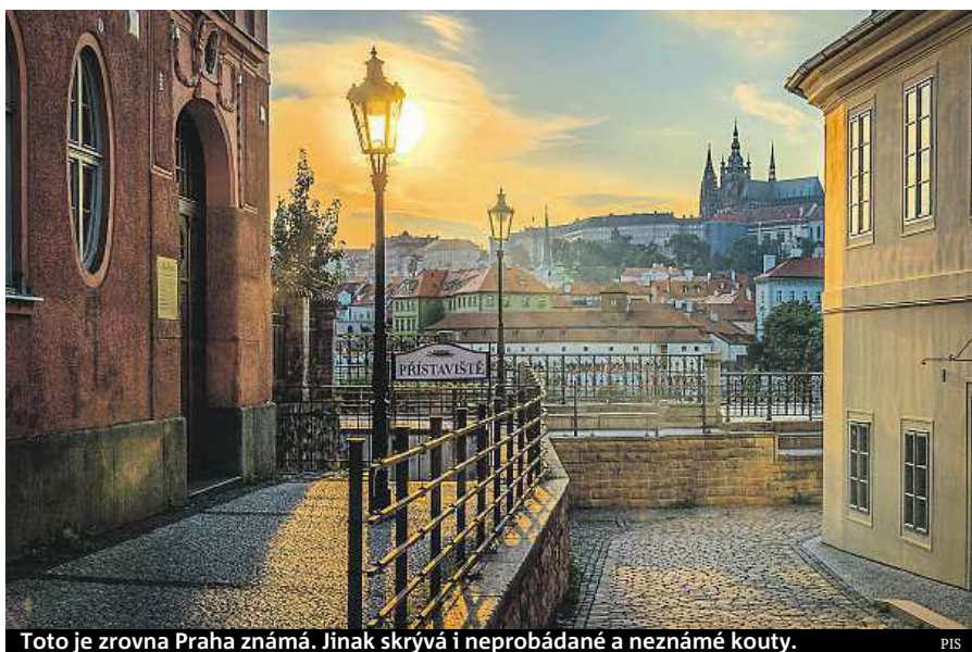
Toto je zrovna Praha známá. Jinak skrývá i neprobádané a neznámé kouty.

Cena 140/100 Kč. Cena prohlídky v angličtině 250/150 Kč.