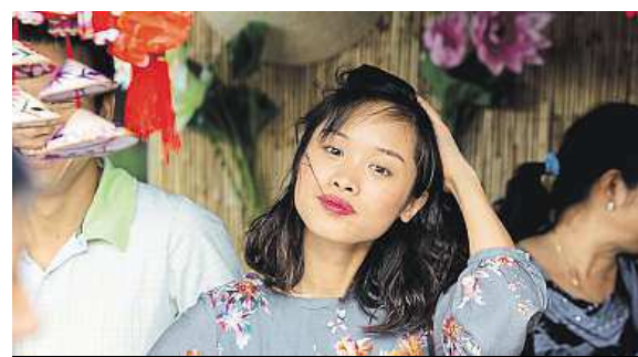
Barevná devítka – multikulti festival v Praze 9