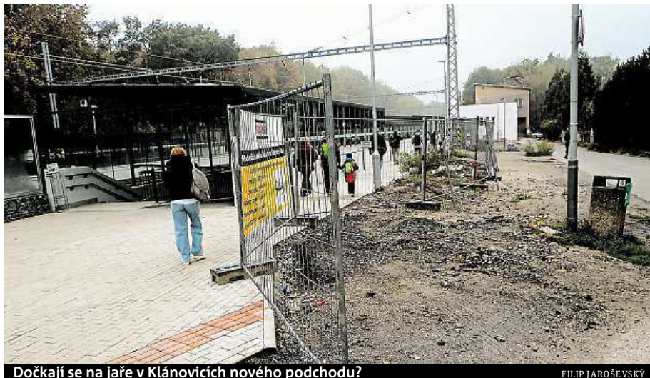
Dočkají se na jaře v Klánovicích nového podchodu?