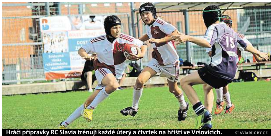
Hráči přípravy RC Slavia trénují každé úterý a čtvrtek na hřišti ve Vršovicích.