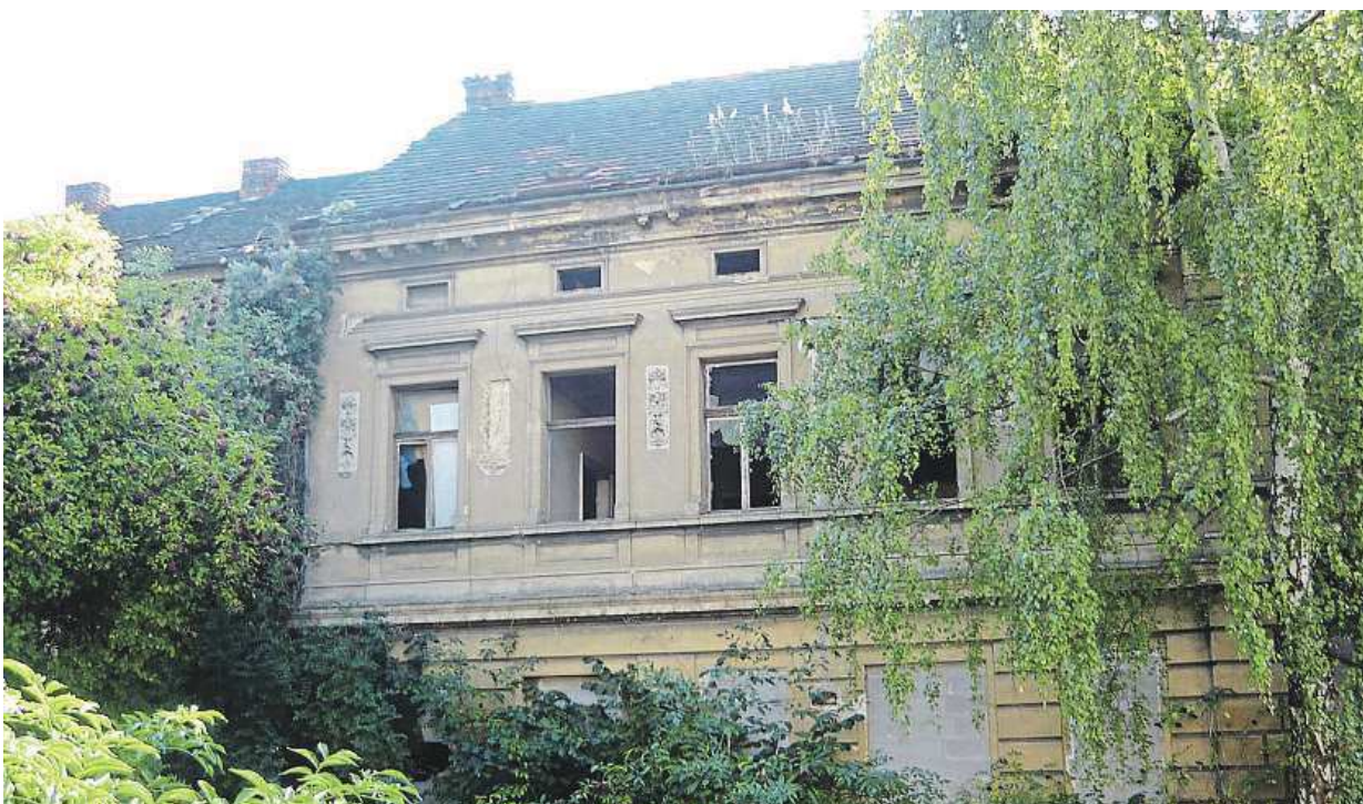
Osud domu je zatím dost nejasný – a jasno nebude pravděpodobně ani v blízké době.

„Vyzvali jsme proto správce konkurzní podstaty, aby dům zabezpečil tak, aby nebyl nebezpečný pro své okolí, což de facto znamená, aby ho zbour-