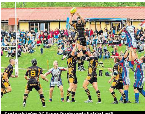
Seniorský tým RC Praga Rugby právě získal míč. RC PRAGA RUGBY