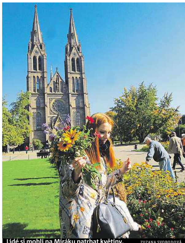
Lidé si mohli na Míráku natrhat květiny.