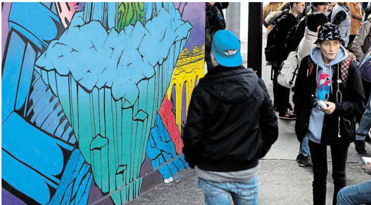
Lidé by podle radnice rádi viděli víc takových barevných terminálů, jako je ten na smíchovském nádraží.

„Tomu nepředejdeme. Podle zkušeností ze zahraničí se naštěstí stávají takto vymalovaná místa obětí vandalismu mnohem méně než běžné šedivě nevábné a nezajímavé plochy,“ říká mluvčí Ropidu Filip Drápal. FILIP JAROŠEVSKÝ