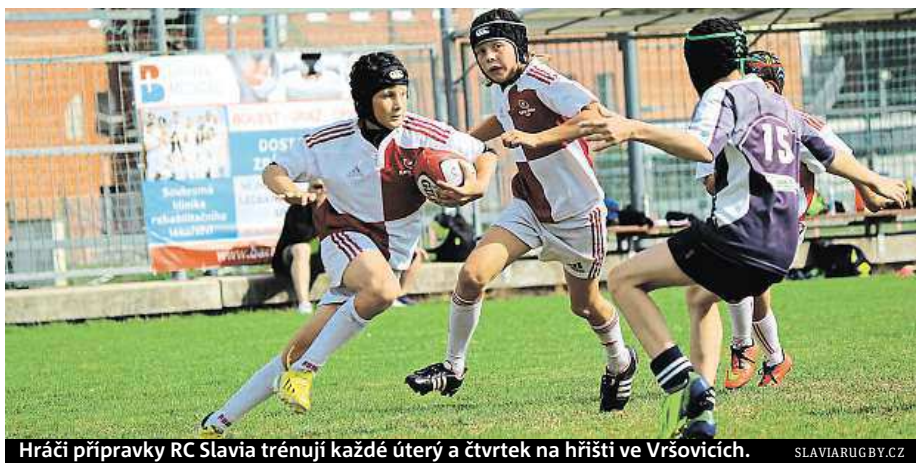
Hráči přípravy RC Slavia trénují každé úterý a čtvrtek na hřišti ve Vršovicích. SLAVIARUGBY.CZ