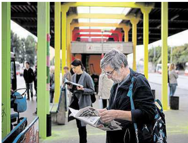
Na díle se podílelo celkem osm umělců a také studenti dvou středních škol. Tvorba podle nich místo oživila.