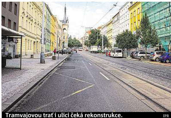
Tramvajovou trať i ulici čeká rekonstrukce.