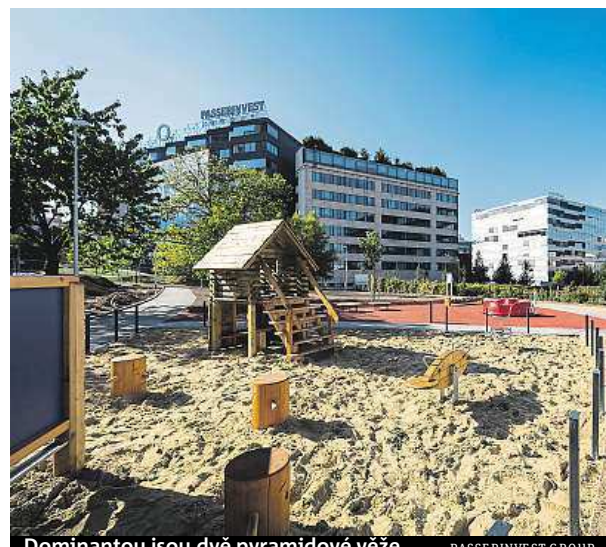
Dominantou jsou dvě pyramidové věže.