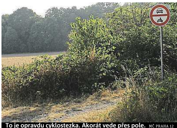
To je opravdu cyklostezka. Akorát vede přes pole. MČ PRAHA 12

„Podle předběžných informací od Technické pravy komunikací hlavního města Prahy je možné, pokud se nezdrží stavební řízení, zahájení prací v roce 2017,“ řekl Metru Řezáč. Zdržení je ale hodně pravděpodobné. Podle Řezáče má totiž na délku projednávání negativní vliv také řešení majetkoprávních záležitostí. Cesty se totiž během času, jak je lidé užívali, vychýlily z pů-