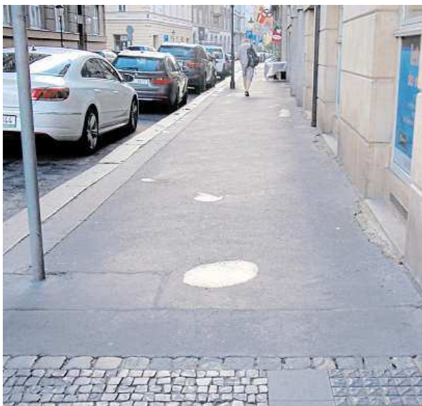
Bílkova ulice před rekonstrukcí a po ní. Místo asfaltu je na chodníku tradiční dlažba z malých kostek.