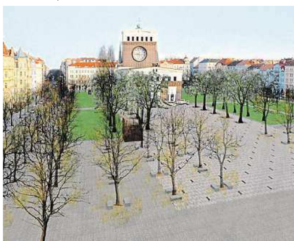
Revitalizace náměstí Jiřího z Poděbrad

Trhovci byli kvůli ničení zeleně už několikrát pokáráni. „Pořadatel farmářských trhů již byl upozorněn na nutnost dodržování povoleného rozsahu záboru,“ potvrdila mluvčí trojky. Ta zároveň dodala, že by měl být trávník částečně oživen. „Na travnatých plochách proběhne ošetření stávajících trávníků spočívající v částečném doplnění zeminy