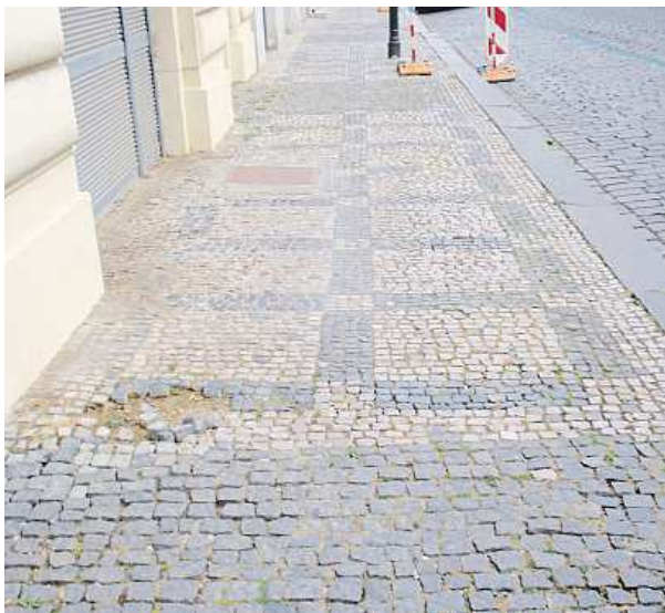
Z nové dlažby se mohou těšit i chodci v ulici Elišky Krásnohorské.