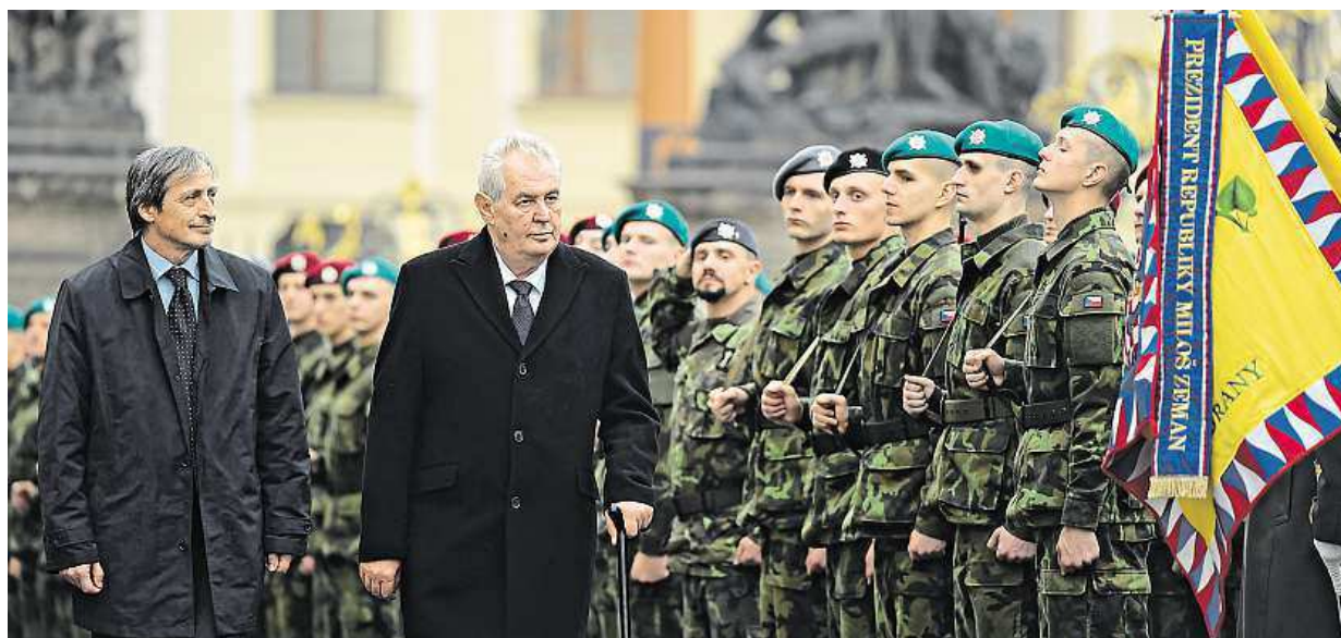
Oslava samostatnosti. Prezident a ministr obrany se včera v Praze zúčastnili přísahy vojáků. Více na straně 3

Zájem roste. Na reprodukční kliniky chodí více párů, kterým se nedaří zplodit dítě. Priority. Kvůli jinému životnímu stylu se posouvá věk, kdy partneři zakládají rodiny. Cena. Čím starší pár, tím víc zaplatí STRANA 2