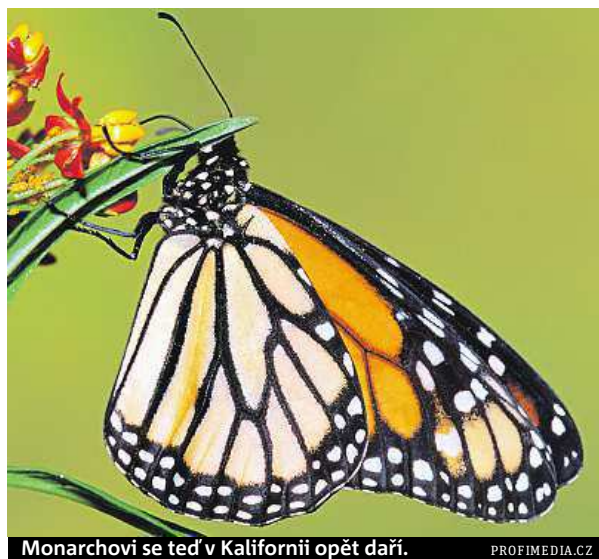
Monarchovi se teď v Kalifornii opět daří.

Mnozí majitelé vyprahlého trávníku se kvůli šetření vodou a zákazu zalévání rozhodli do své zahrady vrátit původní kalifornské klejchy, což jsou suchomilné trvalky zvyklé na suché podnebí. Nektar z květů těchto druhů slouží jako monarchova potrava, listy navíc spásají housenky před zakuklením. Na zvýšenou popularitu suchomilných rostlin