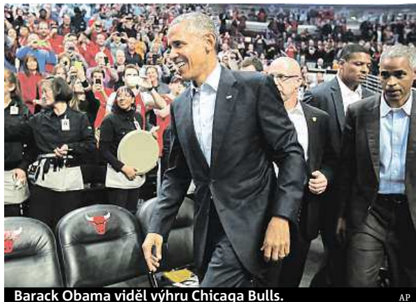
Barack Obama viděl výhru Chicago Bulls.

V dalších duelech Detroit porazil Atlantu 106:94 a Chicago zdolalo Cleveland 97:95. Výhru Bulls sledoval hned u hřiště jejich velký fanoušek, prezident USA Barack Obama. ČTK