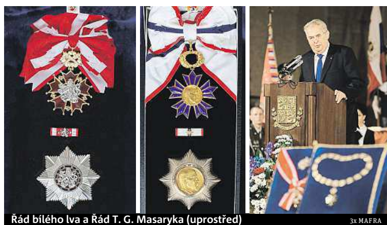
Řád bílého lva a Řád T. G. Masaryka (uprostřed)