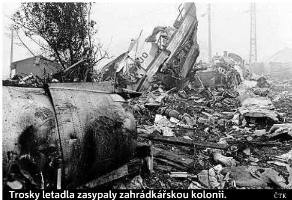
Trosky letadla zasypaly zahrádkářskou kolonii.

Na palubě stroje patřícího jugoslávské charterové společnosti Inex-Adria Aviopromet bylo 115 československých turistů, kteří se vraceli z dovolené v Jugoslávii. Let z prosluněného černohorského letoviska Tivat probíhal bez komplikací až k Praze, nad níž se za brzkého dopoledne držela hustá podzimní mlha. Nece-