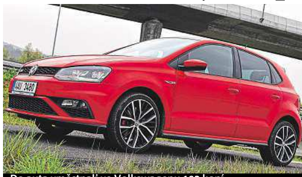
Do auta vměstnali ve Volkswagenu 192 koní.

Všechno je hezky po ruce, jednoduché a příjemné na dotek. Zvenku je vidět jiný přední nárazník a pár změn prodělal zadek auta. Startujeme, na neutrálu ženeme auto do vysokých otáček a posloucháme zvuk motoru. Jo! Tady inženýři vyndali hlavy z písku. Motor s obsahem 1,4 litru poslal dětem do motokár, ko-