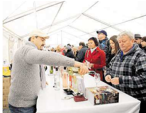
VINAŘSKÝ FOND ČR