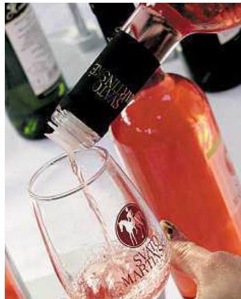
Přijďte ochutnat Svatomartinské víno.