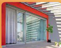
zdvížeň posuvné dveře