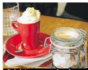
Drink Lemur se závazky