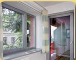
design imitace hliníku