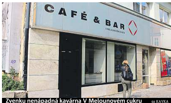
Zvenku nenápadná kavárna V Melounovém cukru 4x KAVKA

Pokud máte rádi v kavárnách svůj klidný kout na čtení nebo třeba rozjímání, v Melounovém cukru ho asi nenajdete. Atmosféra podniku je explozivní, dynamická a živá, spíše než na zadumání a hluchnější bavící se skupinky. Vtipný je koncept venkov-