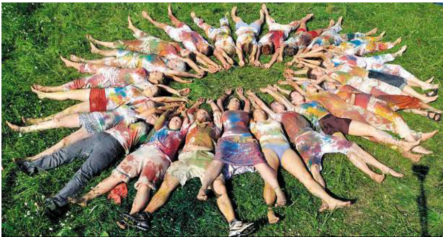
Brontosaurus dospěl do čtyřicítky, ale nadšení mláďa mu zůstalo.

„Hnutí vzniklo z nadšení mladých lidí a jejich touhy dělat něco smysluplného a trochu svobodného. Právě obrovský zájem rozhodl, že původně jednoletá aktivita k Roku životního prostředí vyhlášeného OSN pokračuje dodnes. Podmínky se mění, ale základní motivace účastníků zůstávají: potkávat se s vrstevníky, v přírodě spolu mnohé