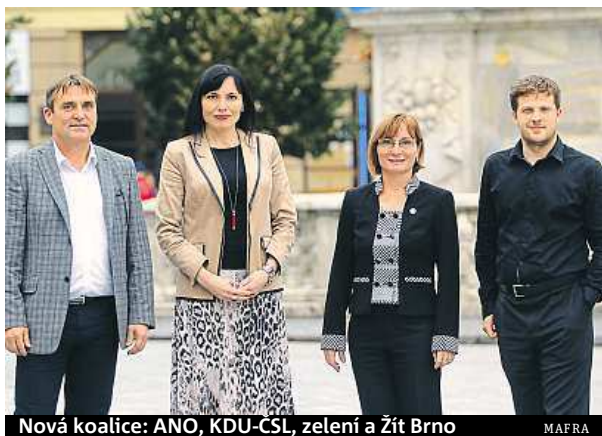
Nová koalice: ANO, KDU-ČSL, zelení a Žit Brno

Podle předvolebních slibů bychom se měli dočkat velkého městského okruhu, naopak nové nádraží do čtyř let je naprostá utopie. Nová koalice plánuje shánět peníze na projekt Janáčkova kulturního centra. A samozřejmě