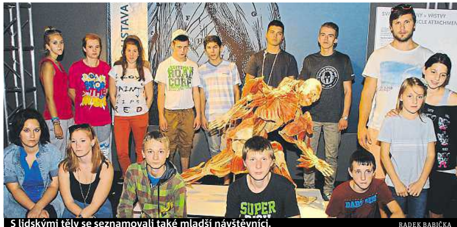
S lidskými těly se seznamovali také mladší návštěvníci.