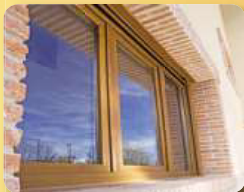
design imitace dřeva