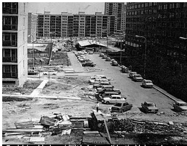
Typický pohled na sídliště. Auta mají (zatím) kde parkovat.