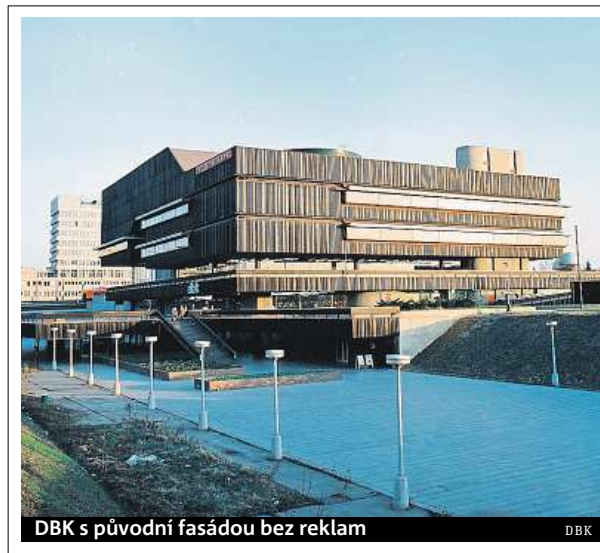
DBK s původní fasádou bez reklam

Výročí si připomíná i dnešní obchodní dům, uvnitř můžete potkat například retrokoutky ukazující jeho nábytkářskou historii. ROW