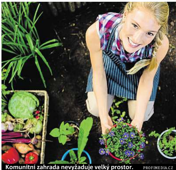
Komunitní zahrada nevyžaduje velký prostor.

V nyní neudržovaném arboretu roste například sekvojec. Dočasná stavba by měla sloužit jako zázemí pro správce areálu. Pátá městská část