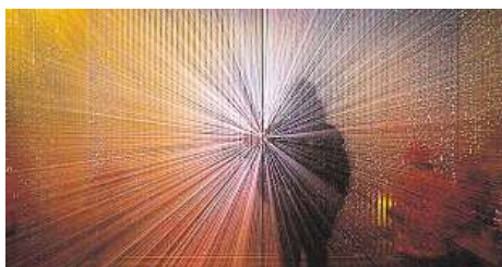
Festival ukáže sférickou show (nahore), světelný nástroj (vlevo) a tajemnou instalaci. SIGNAL