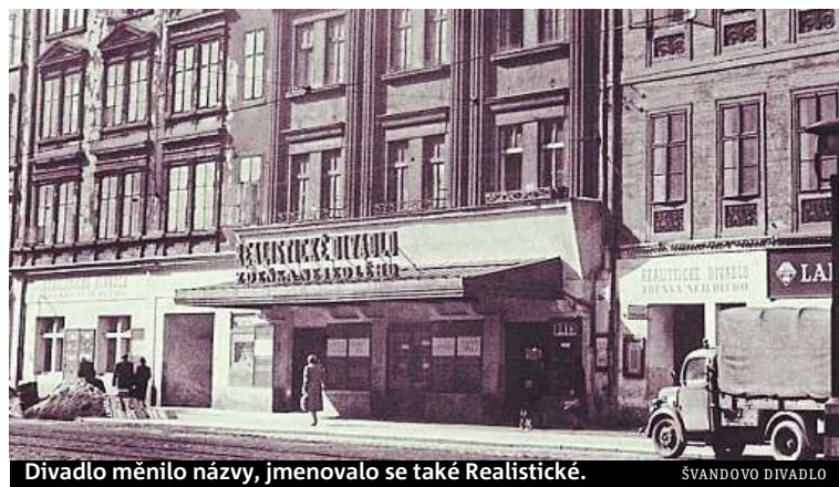
Divadlo měnilo názvy, jmenovalo se také Realistické.