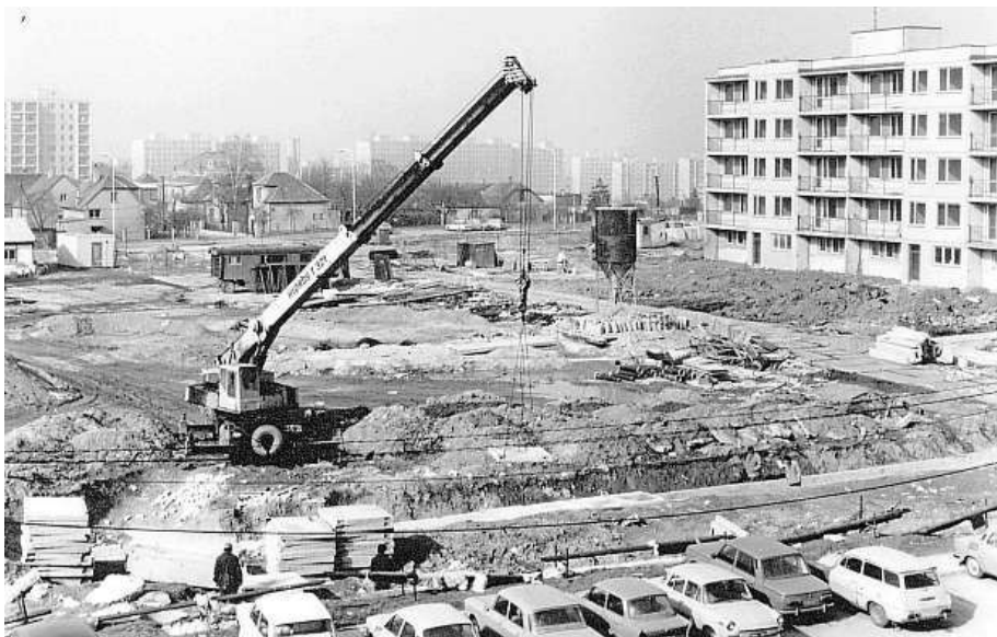
Některé domy už stojí, auta parkují, ale v těsné blízkosti je další staveniště.

Výstava odhaluje vize architekta Lasovského, představuje Švabinského Chodovskou madonu nebo navigační systém Jiřího Rathouského, ale