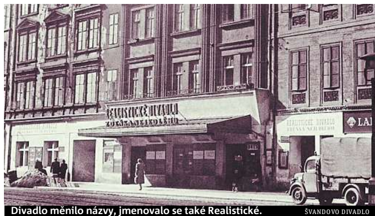
Divadlo měnilo názvy, jmenovalo se také Realistické.