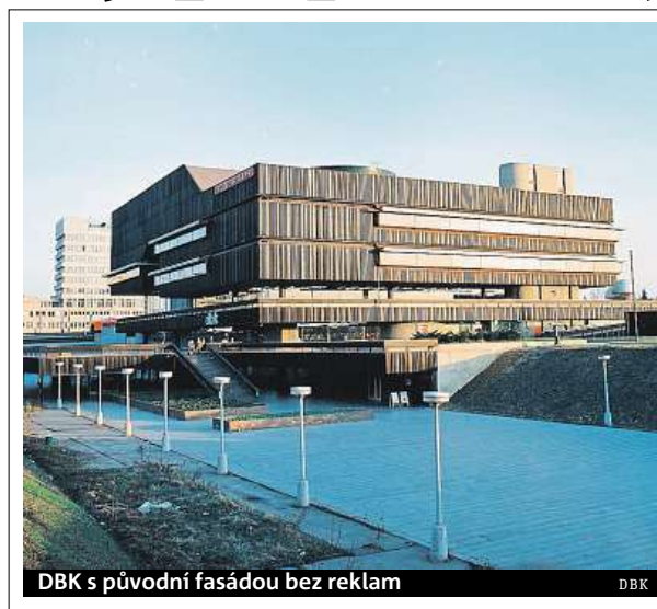
DBK s původní fasádou bez reklam

Výročí si připomíná i dnešní obchodní dům, uvnitř můžete potkat například retrokoutky ukazující jeho nábytkářskou historii. ROW