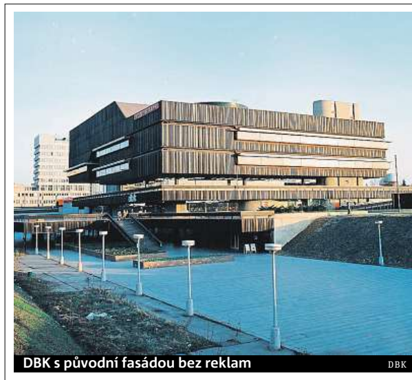
DBK s původní fasádou bez reklam

Výročí si připomíná i dnešní obchodní dům, uvnitř můžete potkat například retrokoutky ukazující jeho nábytkářskou historii. ROW