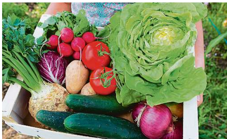
Tak třeba taková okurka obsahuje až 97 procent vody. V těsném závěsu se drží ledový salát (95 až 96 procent vody) a cuketa (92 až 93 procent vody).