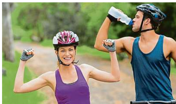
Pitný režim hraje velkou roli i při sportovním výkonu.

K dehydrataci je lidské tělo náchylnější při sportování nebo fyzické práci. Pitný režim by se proto měl v případě zvýšené námahy pečlivě hlídat. „Měli bychom si uvědomit, že každý den vydýcháme asi půl litru tekutin ve formě vodních par. K tomu je nutné