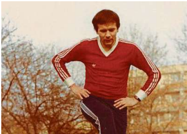
Lochman se narodil v roce 1950 v okrese Ústí nad Orlicí. Žonglovat začal ve svých dvaceti letech.

Od roku 1986 je držitelem světového rekordu, přesto o něm málokdo ví.