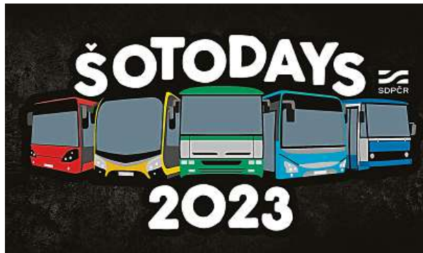
Chystá se první celorepublikový sraz fanoušků MHD. Akce se koná v Brně pod záštitou Sdružení dopravních podniků ČR.

„Do akce se zapojily podniky z Brna, Českých Budějovic, Jihlavy, Karlových Varů, Olomouce, Opavy, Ostravy, Pardubic, Plzně, Prahy a Dopravní společnost Zlín-Otrokovice. Autobusy budou vystaveny, a tedy i fotoaparátům nastaveny, na Výstavišti Brno, poté se vydají na takzvanou Barevnou jízdu širším centrem Brna,“ dodává Vávro s tím, že budou násled-