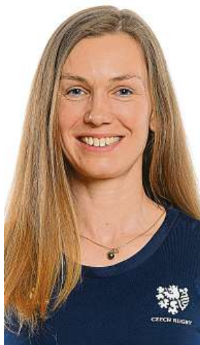
Bývalá atletka, gymnastka nebo plavkyně propadla ragby.