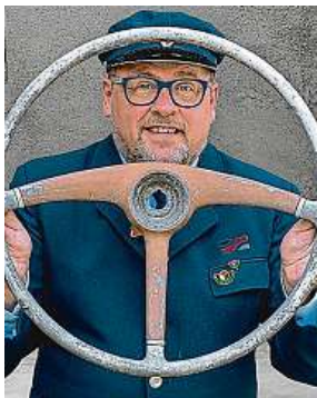
Kopta je šotoušům znám také ze seriálu Bus Salon. 2x SDP ČR

Možná se ptáte, proč o akci s názvem Šotodays 2023, která se odehraje 23. září v moravské metropoli, informuje Plzeňan. Vtip je v tom, že se akce koná pod záštitou Sdružení dopravních podniků ČR (SDP ČR). Do organizace se tedy zapojuje celkem jedenáct dopravních podniků na-