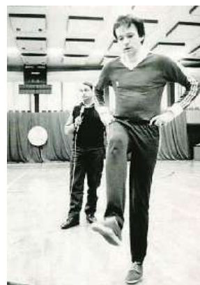
První na světě začal žonglovat s pingpongovým míčkem.