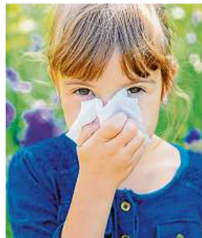
Je tu období viróz.