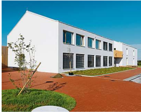
Základní škola v Psářech u Prahy. Budova pro 540 žáků je pasivním domem, který má velmi nízkou spotřebu energie na vytápění.