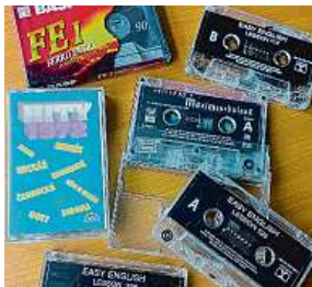
Magnetofonové kazety byly ve své době nenahraditelné.

Už jste nemuseli mít doma na své oblíbené skladby neformální gramofon či objemný kotoučový magnetofon. Audiokazety vnesly revoluci také do běžného nahrávání